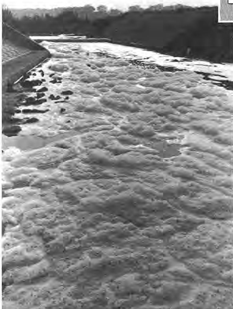
河川や沼への洗剤流入を裏づけるかのように、川の水面に広がる白い泡 一・大津川、中の橋付近

このほど市が発行した環境白書ともいべき「柏市の環境保全」では、手賀沼汚染の元凶である大掘川、大津川は「徐々に水質の浄化の様子が見られる」と述べています。河川の汚染度を測る一つの目安、BOD(生物化学的酸素要求量)の数値は、大津川は最高五〇PPMから一番きれいな所で九・三PPM、大掘川は最高三五・七PPM、最低がその河口付近で一三・四PPM(昭和五十三年測定)。両河川ともまだ環境基準値を上回っているものの、大津川で横ばい傾向、大掘川は測定箇所五カ所のうち三カ所がここ数年BOD値を減少させてきています。一方、大津、大掘の両河川が流入する手賀沼は、県の水質調査に