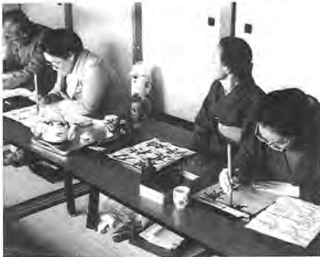
合同展での作品展示めざして練習に励む書道サークルのみなさん

三月七日(金)午前九時から午後四時まで豊四季台近隣センター(別図)で「シルバークル合同展」が開かれます。これは、教養を高め、趣味をのばしたいというお年寄りたちのサークル(現在二十サークル)が、日ごろの練習の成果をみてもらおうとするもので、一堂に会するの