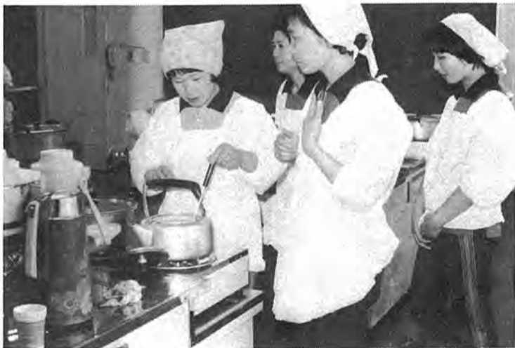
▶ 南部、豊四季台、西原、田中の4近隣センターが3月から4月にかけて相次いでオープン。地域住民の触れ合いの場として子供からお年寄りまで多くの市民に利用されています。建設中の布施、永楽台の両近隣センターをはじめ、今後も各地区に建設されます。写真▶南部近隣センターでの料理教室から