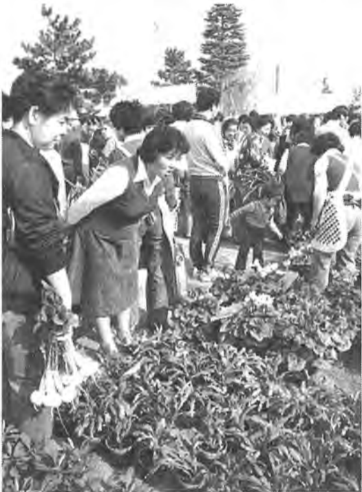
11月3日、千代田町公園で「農業まつり」が行われました。柏の農業を紹介し、同時に野菜や植木、はち物、鶏卵の即売、それに紅白のおもちのサービスも。集まった市民は大喜び。この日は青空市も行われました。