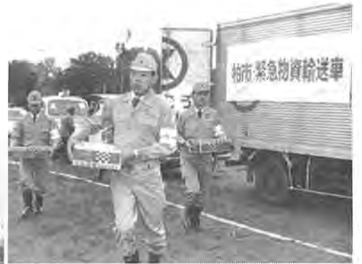
10月18日、柏市内では初めての大きな総合防災訓練が行われ、市民をはじめとする約千人が参加しました。写真—災害時には欠かせない緊急物資の輸送訓練。