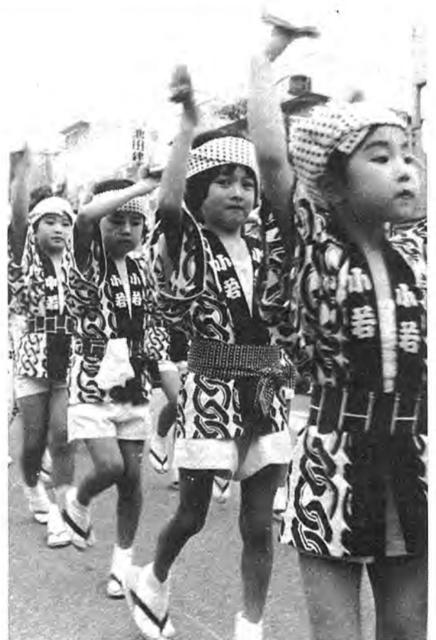
▶ 7月21、22日、'79柏まつりが盛大に行われました。この2日間で約40万人もの人がみこしに、パレードに、柏おどりに。柏市民が一体となる夏の祭典、柏まつり。いつまでも大切にしたいですね。写真▶柏おどりコンテストから