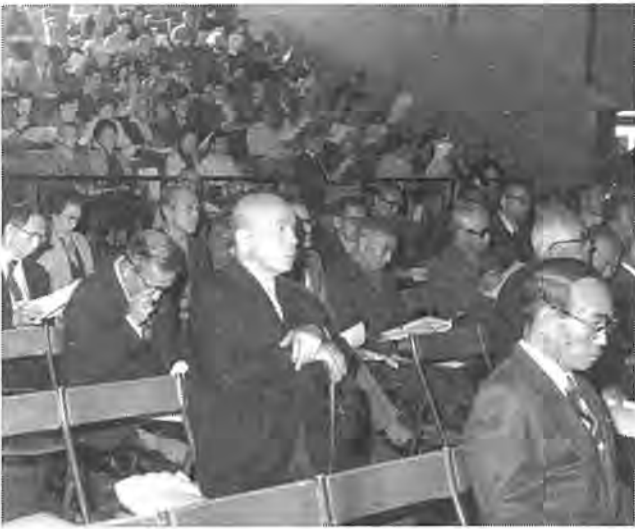
11月16日「柏市高齢者事業団」の設立総会が行われました。同事業団は、就労意欲のある60歳以上のお年寄りて組織され、老後の生きがいを見いだそうというものです。いま、企業、商店、家庭の皆さんからの仕事の申し込みをお待ちしています。写真—中央公民館での総会に集まった会員の皆さん。