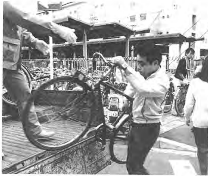
5月10日、柏駅東口に放置されていた「ゴミ自転車」の撤去作業が行われました。その数20台。しかし、その後も自転車は増える一方です。柏市にとって放置自転車は最大の悩みとなっており、抜本的な対策が望まれます。