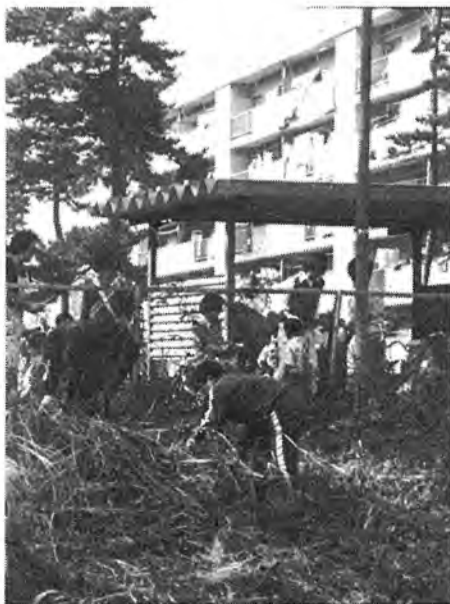
▶ 10月21日「ふるさとクリーンデー」と銘打って、柏市内全域で一斉に清掃が行われました。この作業にも多くの市民の皆さんが参加。大堀川、大津川をはじめ、駅周辺や公園、道路まですっかりきれいに。写真▶豊四季台団地で