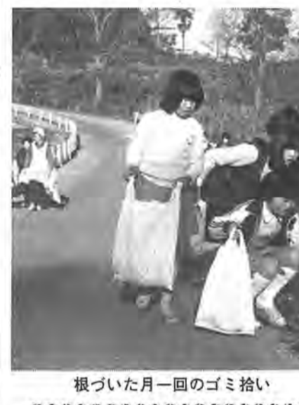
根づいた月一回のゴミ拾い

の児童と父兄による、親子ゴミ拾いが行われました。 ゴミ拾いを始めるようになったのは、田中小学校が学区内の花野井や、大室、小青田など各