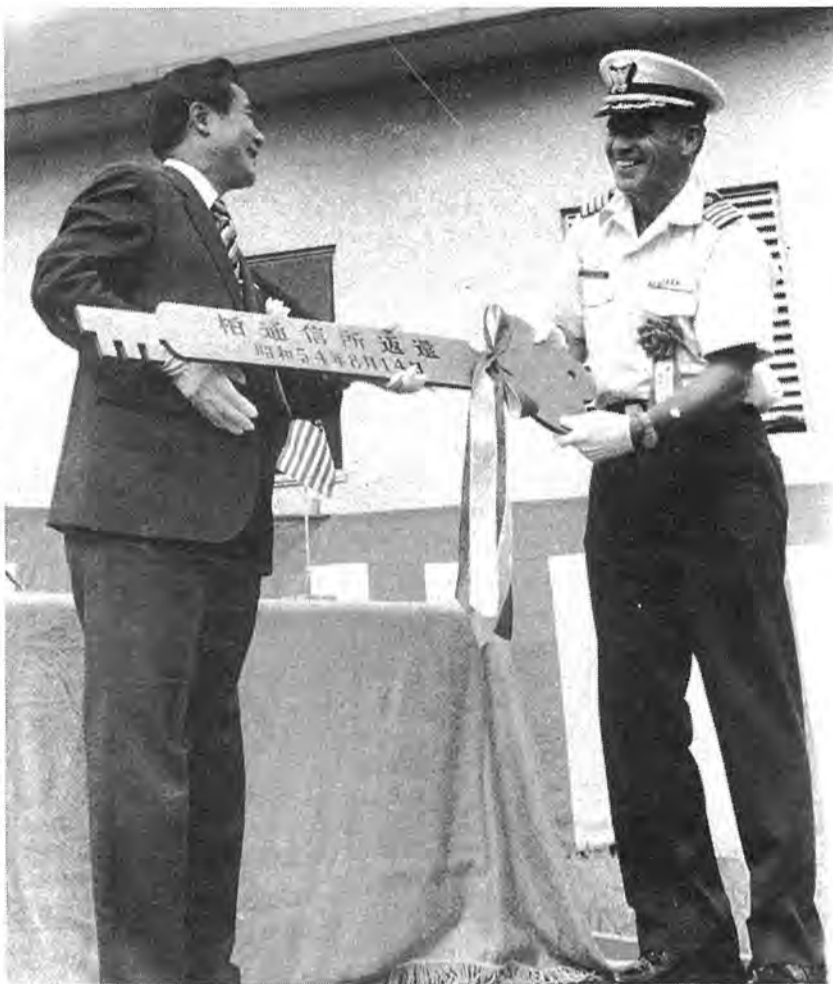
▶ 8月14日、米軍柏通信所跡地の未返還部分95ヘクタールが返還され、これで188ヘクタールの全部が我が国に。公園や緑地を中心とした跡地利用案が、近隣市町と検討されており、その成り行きが注目されています。写真▶米沿岸警備隊のレス・パランス大佐(右)から高島正一・東京防衛施設局長(左)に返還のキギが。