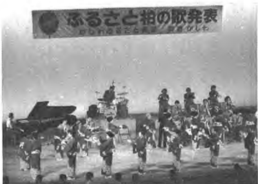
▶ 11月28日「柏市制25周年記念式典」と「ふるさと柏のうたの発表」が市民文化会館で。これを契機に「柏に住んでよかった」と言えるまちづくりを目指す「ふるさと運動」を積極的に進めていくことになりました。