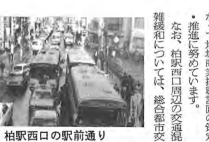
柏駅西口の駅前通り

▽新たな視点の基本構想 現在、昭和六十五年を目標に基本構想の見直し作業を進めています。ふるさと運動と周辺対策を最重点に、生活環境改善を基調とした都市基盤の整備、健康で安全な市民生活への積極的対応、老人・子供・心身障害者の生きがいと幸せを目指す福祉、教育文化体育施設の整備など新たな視点のもとに事業計画を作成して参ります。