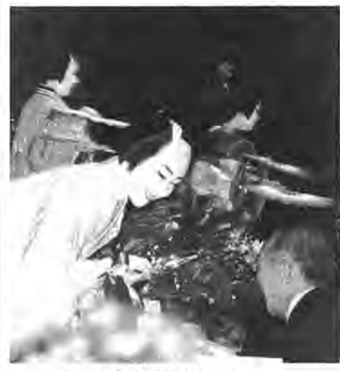
熱演に花束が贈られました