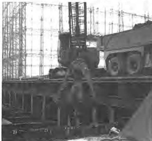
下水道計画に沿って進められている 篠籠田の終末処理場拡張工事

下水道は、私たちの生活環境を快適にするばかりではなく、家庭からの汚水や工場排水などが、直接河川や沼に流れ込むことによっておこる水質汚濁を防止する上で必要不可欠の都市施設です。しかし、私たちは、自分の家庭で出す汚水が、自然環境にどんな影響を与えているかということには、あまり関心を持たないのではないのでしょうか。九月十日を中心とした一週間は「下水道、住みよい町の基礎づくり」をテーマにした下水道促進週間です。これを機会に、市民の皆さんに下水道についての認識を新たにしたいとたくと、将来、柏市の下水の大部分が処理されることになる手賀沼流域下水道と、それに伴う柏市の公共下水道工事の状況をみてみました。