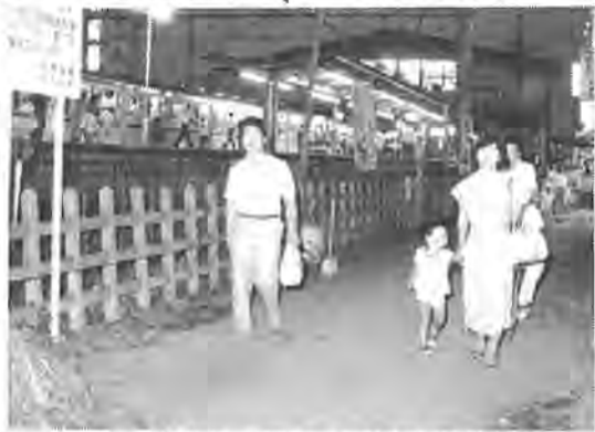
自転車がなくなってスッキリした線路沿いの通路。向こうは南柏駅 — 8月31日夕方

この完成で、同駅東口の自転車駐輪場は全部で二千五百台も収容でき、市内唯一の規模に、近くのお菓