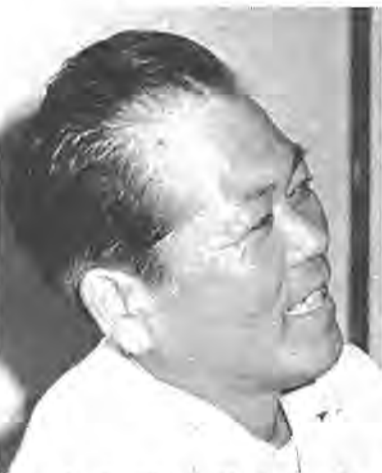
都市農業に取り組む