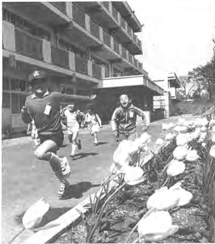
限りない可能性を生み出せる環境を未来を担う「柏っ子」に＝逆井小で