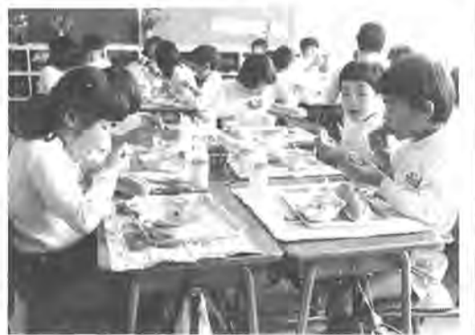
子供の成長。その源は正しい食生活から＝高田小で

現代の子は、体位は向上しているが、体力は弱まっている。これが、全国学校保健調査で表わされた子供たちの姿です。また、健康面では、むしろ、近視に加え骨折が多くなっていると指摘されています。こうした、体位と体力の不均衡、健康面の弊害を子供たちから取り除かなければなりません。