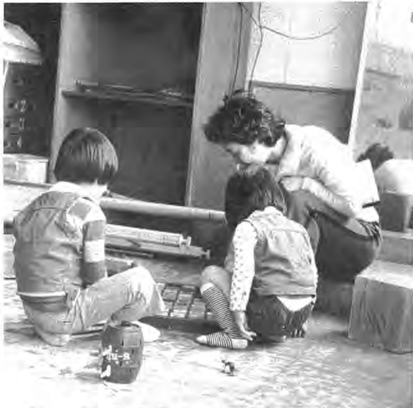
ともに遊びあう中から、安心してつきあえ、やりとりのできる関係を育てていくのも治療の1つ

「ことばの記録という質問紙で、出産時の様子、赤ちゃんのころの様子、家族構成、からだの発達、健康状態などを聞くことと一時間半。午前十一時半、次の来室日を決めAさん帰る。言語指導を担当する三人の福祉指導員が今後の対策を練る。一場面です。