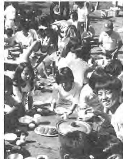
遊びで広がる子供の世界＝子供会のキャンプ

子供会は、野球やポトボールなどのスポーツ、キャンプ、祭りなど子供に欠かさない遊びを主とした行事の中で、責任感や自主性、創造性、さらには「ふるさと意識」を培う役割をします。年齢がちがひ、家庭環境も異なる子らの集団「子供会」は、学校生活や家庭生活では得られない貴重な体験を子供たちに与えます。