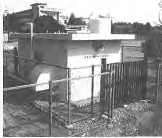
災害時の市民の水の確保に役かう「非常用飲料水供給装置」＝柏中校庭で

「地震などの災害時でも市民の飲水量は万全に」と、市では災害時の避難場所である柏中の校庭内に「非常用飲料水供給装置」を設けられた装置は、深さ百一・