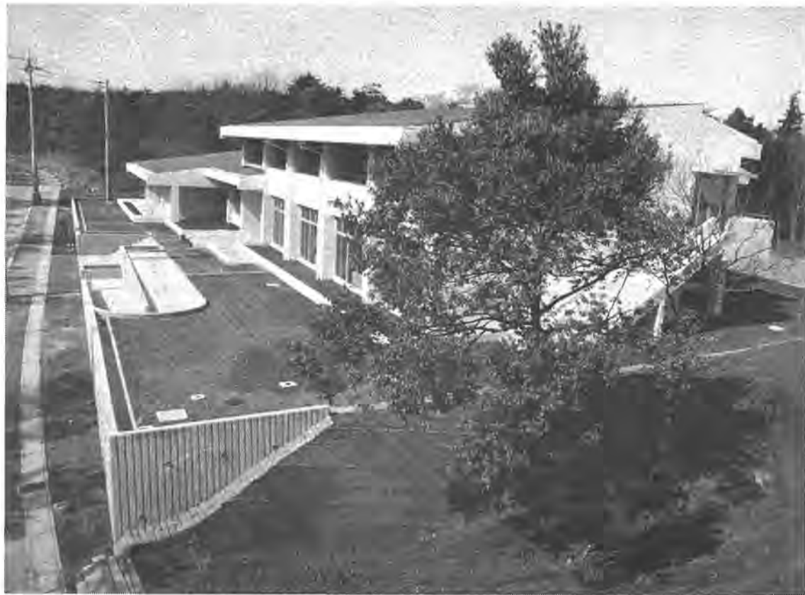
緑の中、地域住民の利用を待つばかりの南部近隣センター

発行 / 柏市役所(〒277 千葉県柏市柏5-10-1 ☎0471-67-1111) 編集 / 市長公室広報広聴課 発行日 / 毎月1日・15日