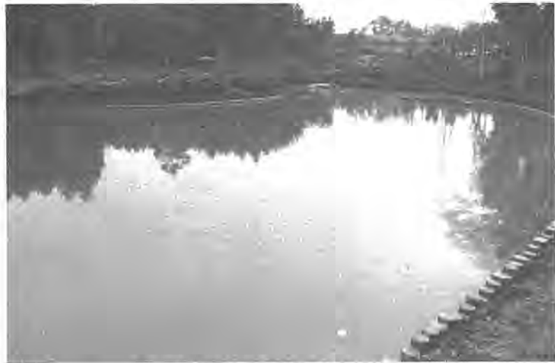
緑と水を調和させた水生植物園は、純日本風のたたずまい(3月5日写す)

都市に潤いとやすらぎを与えてくれる公園。今や、都市に住む人にとって、欠くことのできない憩いのスペースとされています。 市では、昭和五十三年から布施にあるあけぼの山公園に隣接させて「水生植物園」の建設を進めてきました。この三月三十一日に開園することになりました。 この水生植物園の広さは、約一万一千平方メートル。総事業費は七千七百九十万円。あけぼの山公園と一体化されるので同公園全体の面積は、およそ三万八千平方メートルになり市内最大のものになります。 園内は、ショウブなど水生植物を植えた約二千平方メートルの池を中心とし、池には中州をつくり、あずまや、橋、ベンチを配置。入口付近には約二十五台収容できる駐車場も。自然の湧水と緑の園内は、純日本風の庭園を味わわせてくれます。 今後は、市が増尾のウイスキー工場内を借りて養殖しているホタルを来年夏には本格的に飛び交えたい計画もあります。 この整備計画は、同公園の中に