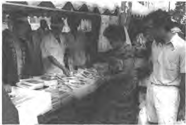
「どうこのタラ子安いよ」(昨年8月の青空市から)

肉、野菜、魚を格安で即売する青空市が開かれます。これは、地元食肉、青果、鮮魚組合に市と消費者が加わった青空市実行委員会主催によるもので、生鮮三品を通常の小売値より安く即売し、消費者サービスをこれまで以上に押し進めようというものです。今回は二回目です。 三月十八日(日)午前九時～正午 (雨天決行) 柏市立柏中学校のアカシア並木沿い なお、当日は、起震車による地震体験や新機種の電話器紹介と実演のほか、おもちや・防災用具の即売、自然食品・焼とりコーナーなども設けられます。