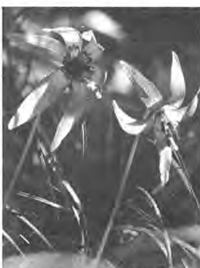
かれんに咲くカタクリの花

その昔、カタクリの鱗茎から作ったカタクリ粉も、現在は、生産が少ないためほとんどジャガイモのデンプンで作られています。それだけカタクリが減っているのかもしれない。 南東に傾斜した雑木林に自生する柏のカタクリ群生地は、いつまでも大切に保護したいものです。「一株くらい……」と思