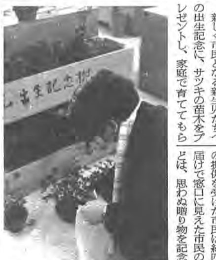
記念の苗木を選ぶ市民(本庁窓口で)

昨年七月、二十種目のアスレチックコースを開いたのに次ぐ第二弾。あけぼの山公園は、大利根の自然を前に、春は市内の桜の名所として、秋はモミジの紅葉と多くめる公園になりそうです。 市民に親しまれています。これに、初夏を飾るショウブ、アヤメなどの水生植物に、夏の風情をたけが加わると四季おりおり楽しむ公園になりそうです。 子供ともども大切に育てたいと思います」と語っています。 市では、三月いっぱいまでは、サツキの苗木一種類としていますが、四月からは、庭植えに用いる苗木と鉢植え用など選べるように種類を増やしています。