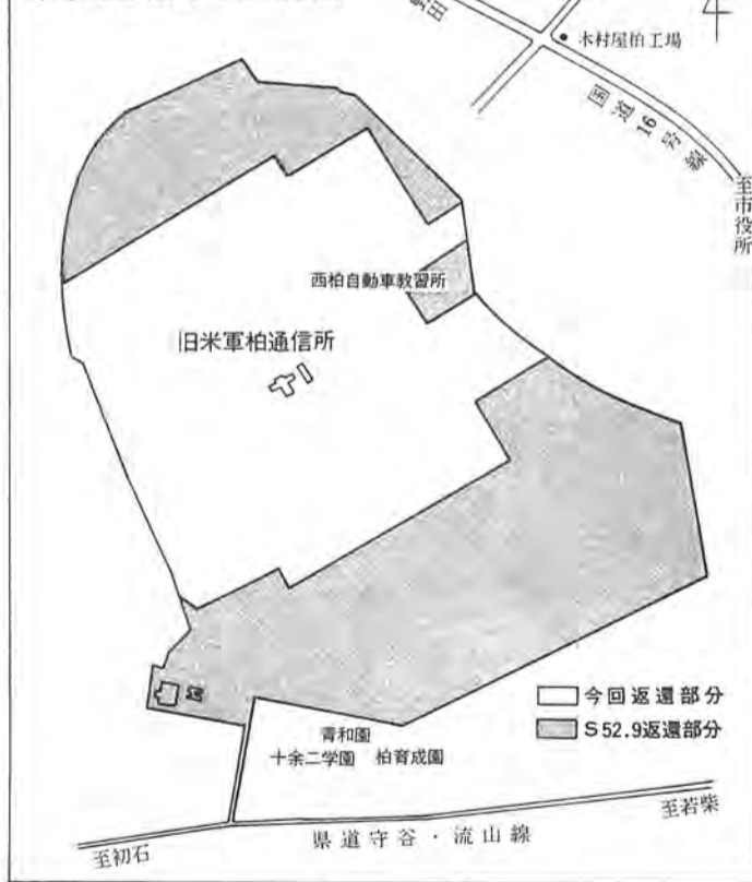
米軍柏通信所用地概略図

去る二月十三日、防衛施設庁東京防衛施設局は、「アメリカ側から、柏通信所用地の全面返還のための手続きを近い将来開始する旨の通告があった」という連絡をしてくれました。この柏通信所は、総面積百八十八ヘクタールで後楽園球場の約四十倍。広