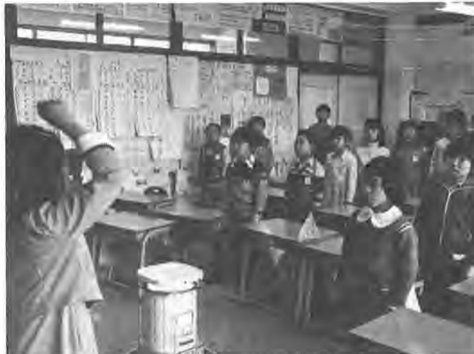
学校じゅうが元気な歌声でいっぱい =酒井根小