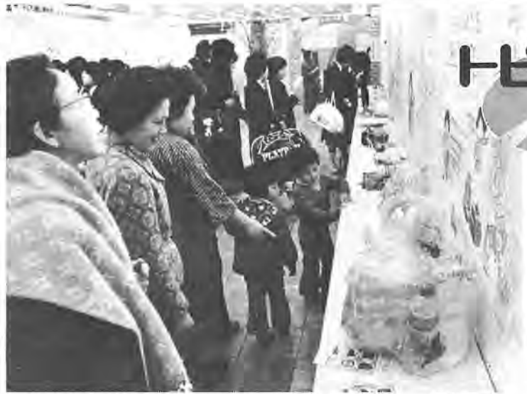
消費生活に対する関心はますます高まっています =高島屋で

「豊かな環境、明るい家庭」をテーマに、二月十五日から二十日までの六日間にわたって開かれた消費生活展。期間中はイチゴの安売りやクッキー作りなどの実演も行われ、会場は子供連れの主婦などでにぎわいました。延べ入場者数は約一万九千人。