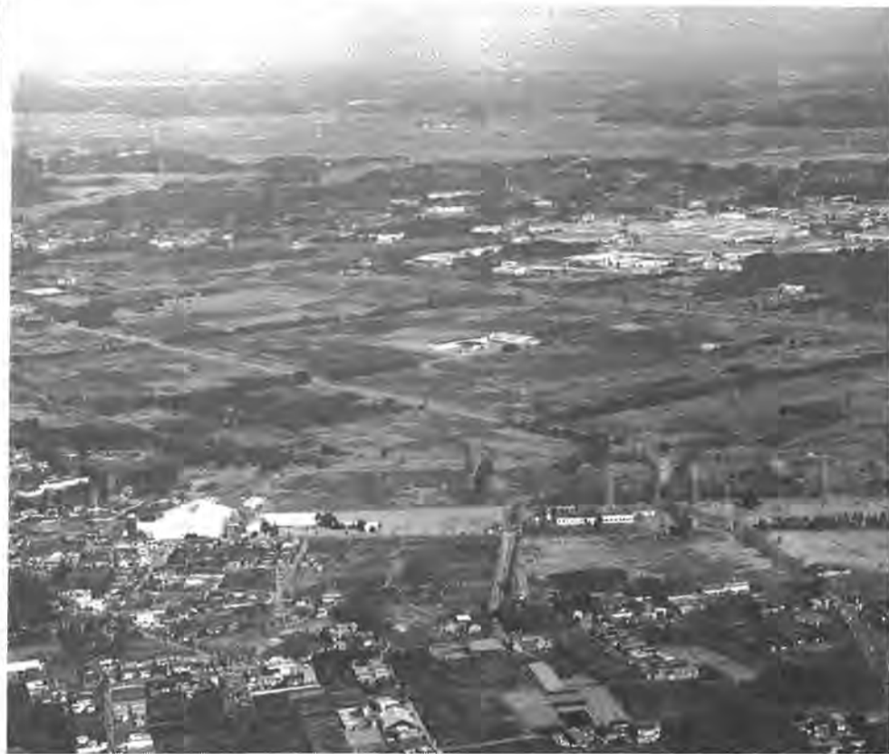
米軍柏通信所跡地。広さは188ヘクタール、後楽園球場の約40倍

発行 / 柏市役所(〒277 千葉県柏市柏5-10-1 ☎0471-67-1111) 編集 / 市長公室広報広聴課 発行日 / 毎月1日・15日