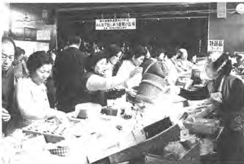
2,000人の入場者でにぎわった昨年の大バザール会場

みんなを出し合う善意の広場をキャッチフレーズに、今年も三月二十五日の日曜日「住民大バザール大会」が開かれます。これは、だれからも関心の持たなければならない住民福祉の問題を市民の皆さんの総参加のもとでともに考えようとするもので、今年で五回バザール大会が開かれます。会場は柏中学校で午後零時半から同三時まで。