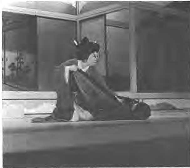
お家騒動を題材にした先代萩の一幕

今年二回目の柏市民文化会館自主事業として、三月三日、同館では、広く海外にも知れ渡っている「歌舞伎観賞会」が行われます。今回、招くのは、「市川女優座」の面々。文字通り出演者は全員女性という一座。