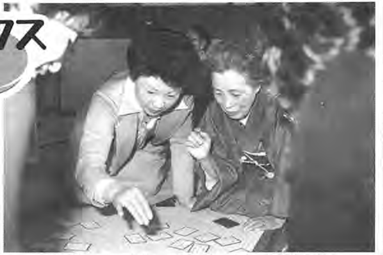
お年寄りと言がベアでとるかるた会。なごやかさの中にも熱気がこもりました = 1月23日、中央公民館で