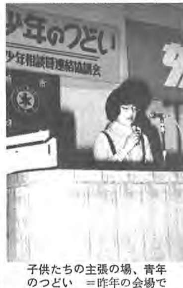
子供たちの主張の場、青年のつどい = 昨年の会場で

市川女優座の前身は、市川少女歌舞伎。豊川稲荷で有名な愛知県豊川市でウブ声を上げました。終戦当時七、八歳の子供が、少女歌舞伎の素地となりました。その後、十代目団十郎の後継者でもあって、昭和二十八年に東京進出。予想外の人気を博し評判を高めました。少女たちの成長と芸の新境地開拓とともに、少女歌舞伎の名称を改称させたものです。