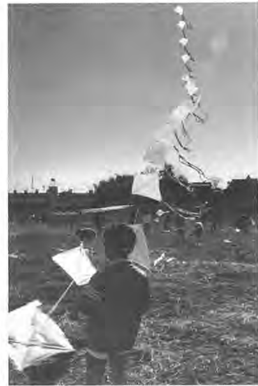
初めてのたこ上げ大会。連だこや立体だこなど、たくさんの手づくりのたこが宙を舞いました = 1月22日、高田小で

長、児童数七百五十八人）で初めての高田小でたこ上げ大会が行われました。この日上がったたこはすべて児童の「手作りの作品」。今は和だこにしても洋だこにしても、買おうと思はずぐに手