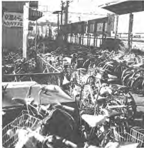
歩道にまで置かれている自転車も駐車場の開設により解消へ

最近、市民の足ともいわれるにまで普及した自転車。通勤、通学や買い物に市内各駅まで自転車を利用する人が激増しています。南柏駅前もその一つ。市の交通安全課の調査では、東口に約八百台(昨年十二月現在)の自転車が路上などに放置されています。この放置された自転車は、場所によっては駅への出入口をふさいだり、バス停での乗降の妨げになるほか、時には歩道を自転車に占拠され、人が車道を歩かなければならないという危険もあります。今までも幸いにも、放置自転車が原因となる大きな事故は起こっていませんが、起きてからでは遅いので、南柏には四方所の無料自転車駐車場を設けるなど自転車対策を講じてきました。増えつつある数は追いつけず、放置自転車は増加するばかり。このような障害となっている自転車を取り除くため、このたび既設の駐車場に隣接する場所に駐車場を設置することにしました。二月中旬から使用できるようにと工事を進めている八百台収容の駐車場は、南柏駅東口から一分足らずの場所、すでに利用されてい