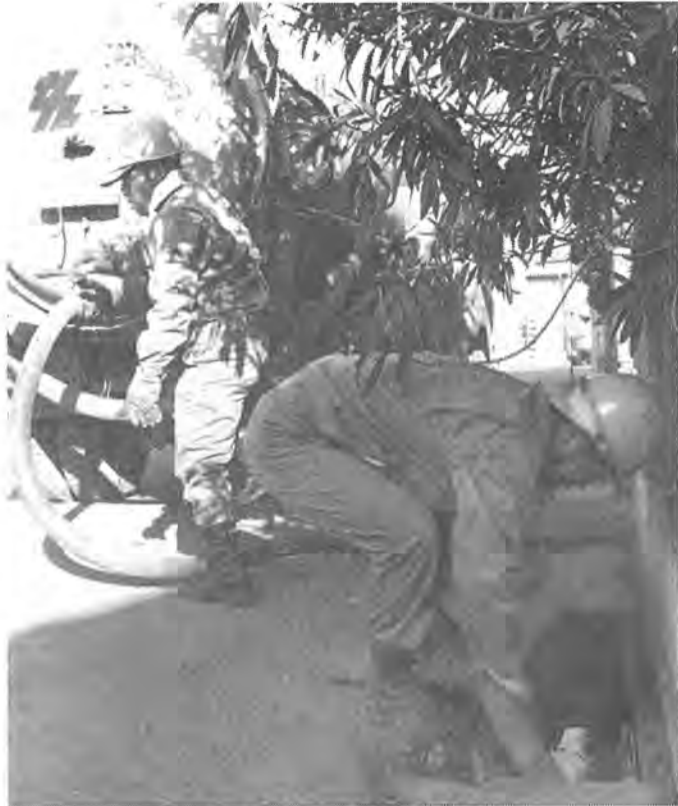
早速、担当課による現地調査や作業が二つしが丘での側溝整備

発行/ 柏市役所(〒277 千葉県柏市柏5-10-1 ☎0471-67-1111) 編集/ 市長公室広報広聴課 発行日/ 毎月1日・15日