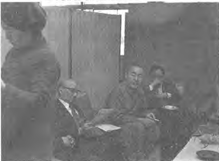
初の市長との対話に駆けつけ、その時間を待つ市民の皆さん