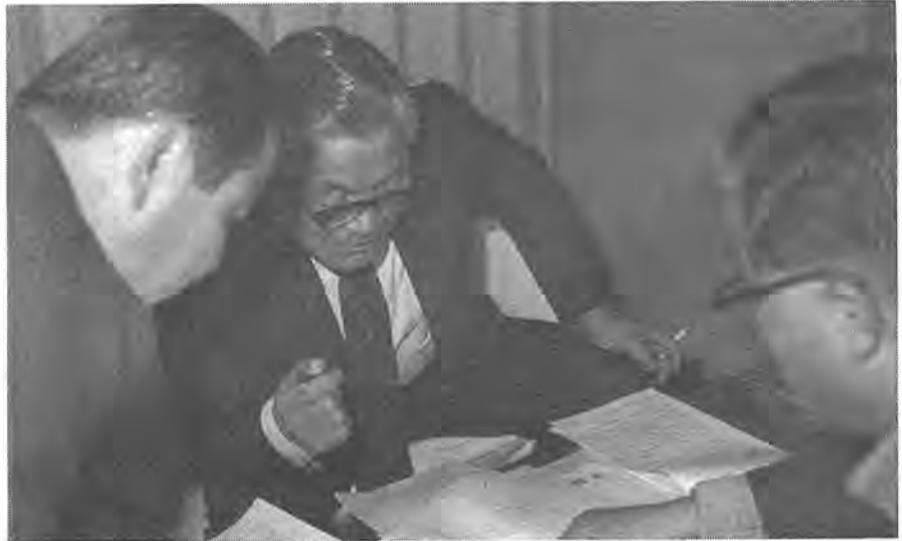
「この道路は、公道なので排水溝を……」。市民からの要望に真剣な面もちで担当職員の意見も交じえこたえる市長