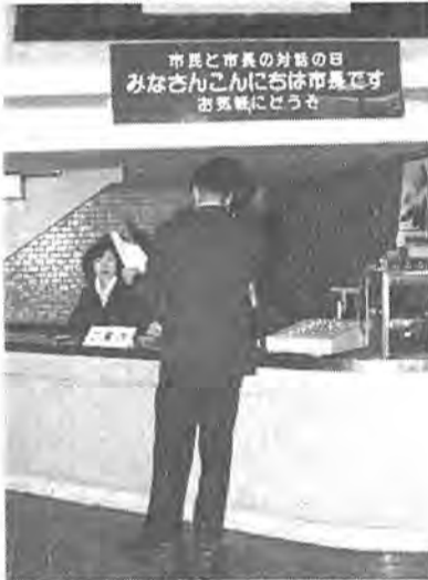
この日、市役所ロビーに臨時の受け付けが設置されました

市長が就任以来、提唱していた「市民と市長の対話」が去る一月二十三日、午後一時から四時までの三時間にわたって行われました。第一回目とあって、待ちかねていた市民十人が受け付け開始と同時に申し出、市政に対しての不満や、また建設的な意見も市長にのべました。なかには土地の賃貸など個人的な要望もありましたが、全般的には、文化向上の施策の予算を考へて欲しい、緑の確保に留意すべき、交通体系を検討して欲しいなど、市政向上のための建設的な意見のべられました。 市長は「表面にでない市民の本当の要望というものがわかる。当然受けられるべき権利のものは直ちに実施し、建設的な意見は謙虚に市政に反映していくように努力したい」と話していました。対話をした人から「もっと時間をのばして欲しい」という要望が多かったことから、第二回目からは平日、午後いっぱいを使って実施することになりました。 また、今後は地域にもむいて、その地域の実情を見ながら話し合う地区懇談会も考えています。