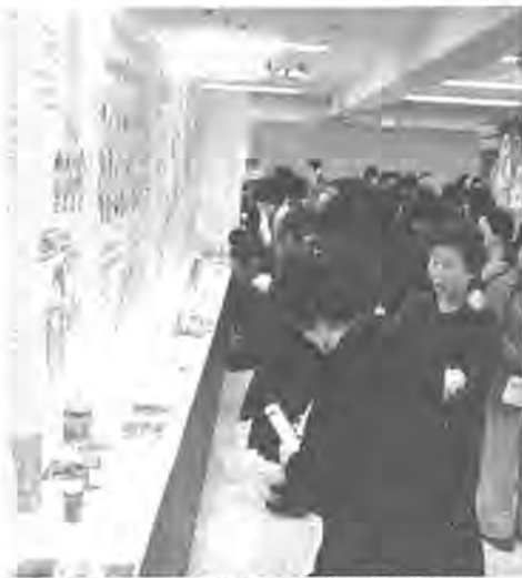
生活の知恵を学ぼうと大げいの主婦たちが詰めかけた昨年の消費生活展

「豊かな環境・明るい家庭」をテーマに「第八回みんなの消費生活展」が、柏市消費生活実行委 随催し場で開かれます。