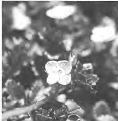
「オオイヌノフグリ」

霜どけの田園や道端で碧(あお)い小さな花をつけている。だれでも知っている雑草だが欧州生まれの帰化植物で星の瞳というところもある。(写真と文・千葉県生物学会委員 斎藤吉永氏)