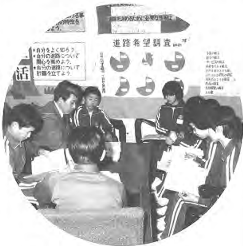
中学校課程の中でも特に重要な進路指導 = 柏中