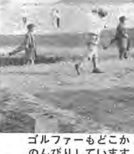
ゴルフアームもどこかゴロンびり

競馬は春秋二回、各三日間開催されますが、それが終わりますと九ホールのゴルフ場でニッポカボカスタイルの紳士やモダンガールがクラブを振る姿が見られるようになります。キャデラックはすべて男子で、東葛中学校(現東葛高)の生徒が替休みや