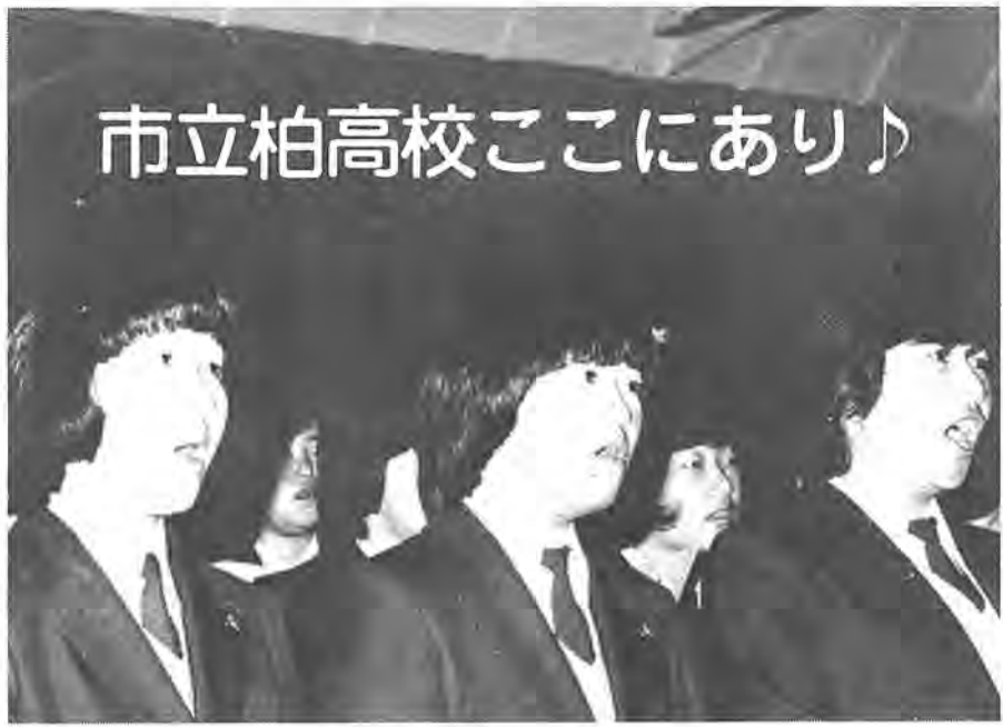
柏市立柏高等学校 校歌