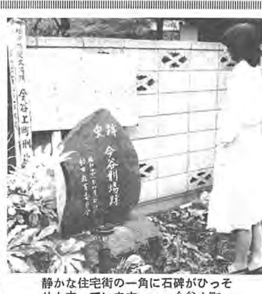
静かな住宅街の一角に石碑がひっそりと立っています =今谷上町=

今谷刑場跡は、今の南柏駅から光ヶ丘団地へ向かう道路となつていて(光ヶ丘小学校の少し手前)にあります。 この刑場では、江戸末期から明治初期にかけて罪人の首が切られたと言われています。おそらく、明治十二年一月四日に梶首(こしゆ)刑が廃止されるまで斬首(ざんしゆ)は続けられたとされています。 しかし、現在ではほとんど跡形もなく、わずかに山林として一部が残っているだけです。 長老の話によりますと、明治の初期に、近くに住む盗賊の首領が捕われ、この刑場で打ち首の刑に処せられたといふことです。ひどく暴れ者だったとて、この首領に殺された旅人は多かつたと言われています。