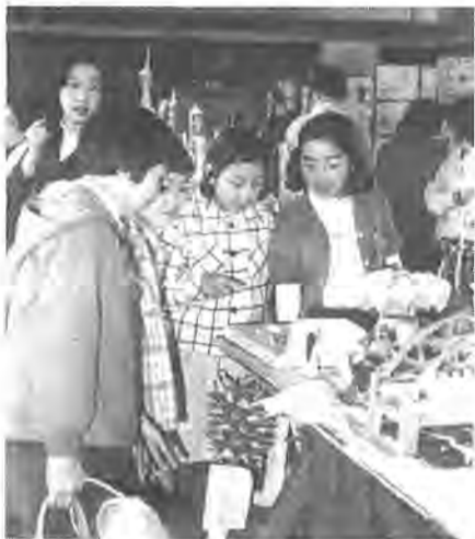
ワーすごい、これガリバーでしょよくできているわね!

作影壁展」と「第五回柏市立小中学校技術家庭科作品展」が、柏一小の体育館で行われ、好評のうちに終了しました。 この作品展は、工芸工芸展