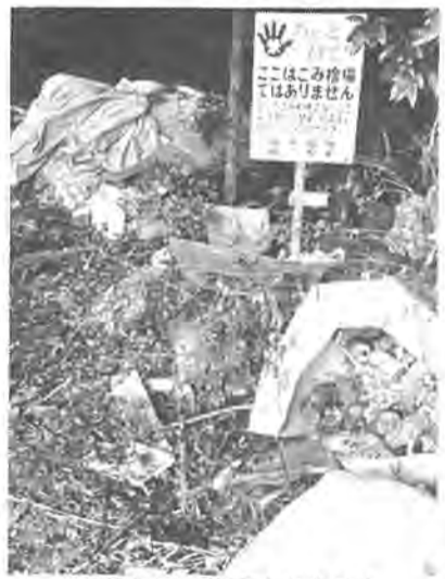
山林に不法投棄されたゴミの山=南部地区の山林で

私たちに潤いを与えてくれる緑の山林や水辺。こうした所に大量のゴミが捨てられているのを見たら、さわやかな気分もだいじになります。 一部の不心得者による不法なゴミの投棄は、応々としてひどい空気が、河川などで行われています。 産業廃棄物は法的な規制があり野放図に捨てることは禁じられています。しかし、産廃の中でも、建物の建設中に出来る廃材類、いわゆる事業活動で出るゴミ、市パトロールの強化、住民の関心が高まったことで一時より減ってはいるもののまだまだ不法投棄がみられます。 この不法なゴミ投棄は、街の美観をそごうばかりでなく、カヤハエの発生を招き、付近の生活環境を悪化させます。市では、防