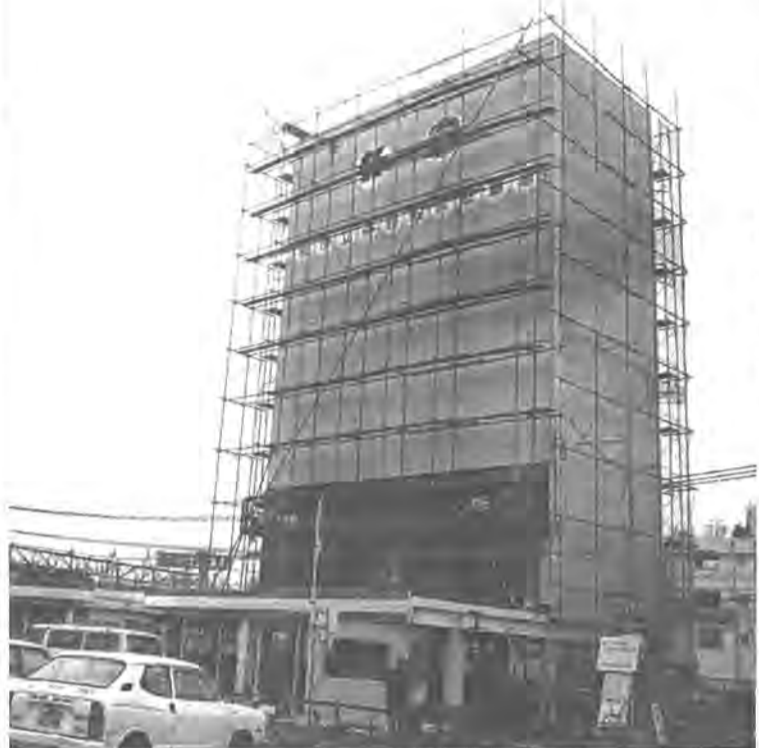
放置自転車の解消に一役かう立体自転車駐車場