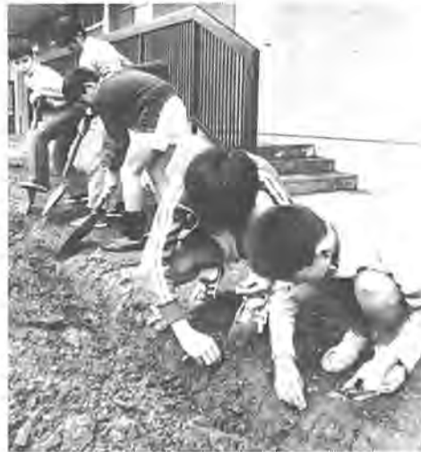
「早く大きくなって」と願いを込めて植えつける名戸ケ谷小の生徒

十月十六日から十一月十五日まで、千葉県緑化推進期間が始まります。緑を増やし保護するのがこの期間のねらいとされています。これに先立ち、十月四日、三井