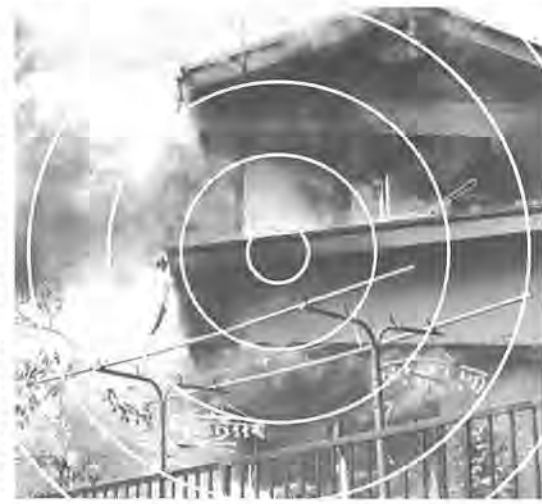
あなたの財産を一瞬のうちに灰にする火災。その時の備えに火災共済を

柏市では、不幸にして火事やガス爆発などで火災にあって、市民の互助で救済する「柏市火災共済制度」を十二月一日から発足させることにしました。この制度は、県下でも柏市が先がけて実施するもの。年間五百円の掛金で、最高は全焼の場合五十万円から消火に