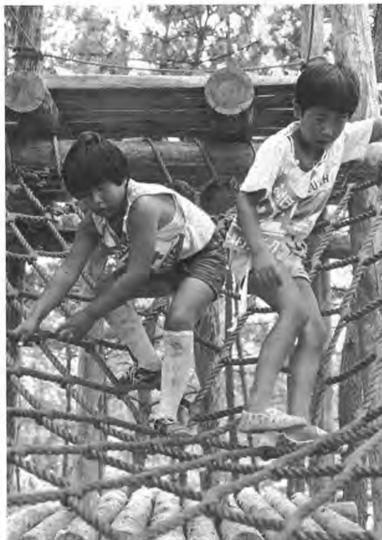
「オッと危ない!」。チビっ子たちも真剣な表情で挑戦しています

人のうごき228,121人(前月より+630人) 66,358戸(前月より+157戸)(53.6.30現在) 発行/柏市役所 柏市柏5丁目10番1号 編集/市長公室広報広聴課 毎月1日15日発行 TEL 67-1111内線223