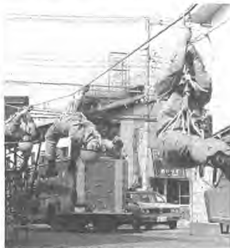
全国大会に向けてさらに熱が入る隊員の訓練

八月四日、千葉県消防学校で行われた「第七回消防救助技術関東地区大会」ロープアクリック救出の部で柏市の特別救助隊(通称レインジャー隊)が堂々と優勝、全