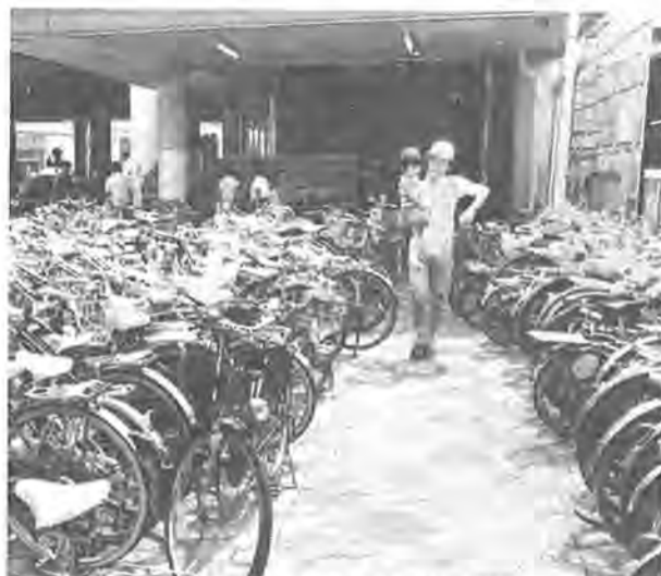
閉鎖されることになる階段(後方)と、この付近の歩道は工事中通行不能に

国鉄が混雑緩和のために計画を進めてきた柏駅自由通路の有効利用を主とする駅改造工事が八月二十一日から開始されます。この工事は東口の我孫子寄り階段を取り壊すことから着手され、事務室を移転し、キップ販売機を後退させ、来年十月下旬までに完成の予定です。これによって通路内の混雑は解消され、人の流れはスムーズにはけることとなります。 現在の柏駅は昭和四十六年四月を築かなければならなかったのに完成し橋上駅舎となりました。が、橋上化され、自由に往来できなくなった。東西交流は駅の入場券の長さ九十五分、幅十分の通路が