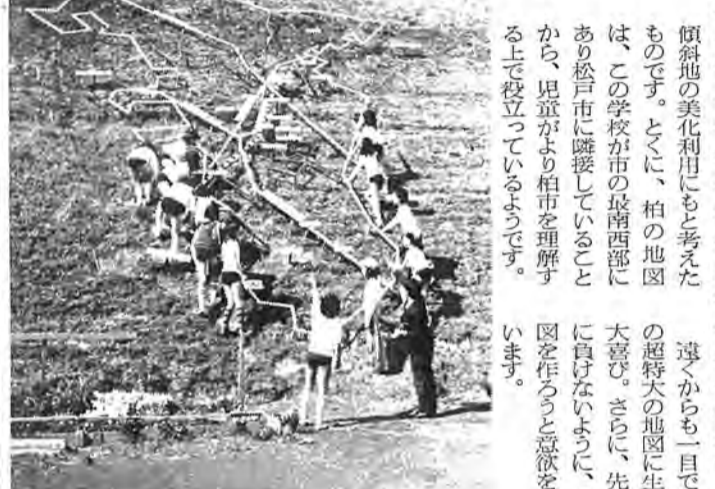
「ここが私たちの学校、あそこは…」と人気も上々の「柏市全図」

これは、社会科の先生の指導で、当時の六年生が中心となり社会科の教材用として、また