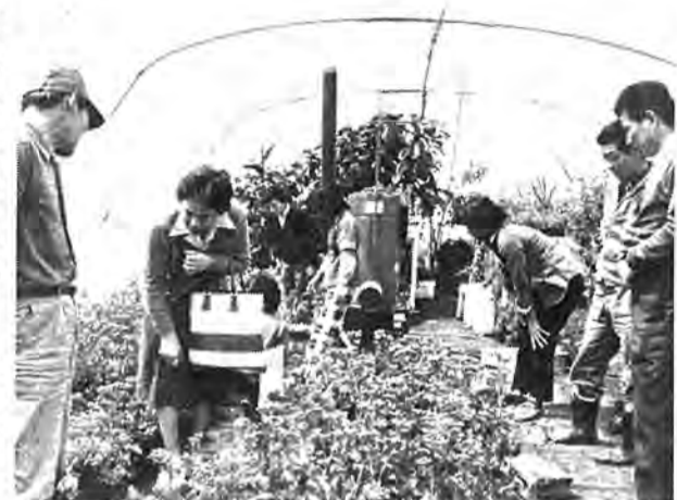
丹精込めて作られた園芸品を見る市民からは「これもいただこうかしら」の声

精神薄弱者通所授産施設「青和園」では、園生が丹精込めて栽培した園芸品の即売が、毎週木・金曜日、同園で行われています。四月に即売されたものは、イチゴの鉢植え、カラコエ、ランタナ、サヤエンドウの箱植えなどでしたが、お天気の良い日は、園芸品の観賞をかねた人たちが大盛況でした。特に、サヤエンドウの箱植えは、ペランタなどでも簡単に栽培でき、しかも収穫が楽しめる