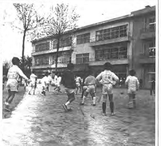
学校は楽しいところ。休み時間には伸び伸びと...