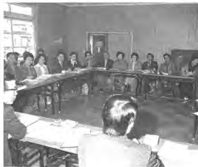
近隣センター作りに地元の声を一と活発な意見交換

地域社会づくりの「核」近隣センターを今年度四カ所建設することを決めた柏市は、その第一号である南区地区の近隣センターの建設に取りかかるため地元との話し合いに入りました。 四月十七日、逆井の南部青年館には、地元十八町会をはじめ老人会、子ども会の代表など三十八人が出席。市側からは担当である市民施設課長が、コミュニティ対策としてのセンターづくりの説明にあたりました。 市の概要は、土南部小学校近くの敷地約二千三百平方メートルの中に延べおよそ千平方メートルから二千平方メートルの近隣センターをつくり、これを地域住民の連帯感を培う場として提供したいというものです。 市では、このセンター建設にはできるだけ地元住民の意見を取りあげ、その要望に沿ったもので、地元住民の利用しやすいものにしようとしています。このため、この地区では二月末から話し合いに入り、すでに地元代表者たちが市のセンター視察を行うなどの動きを始めてきました。 市でも初めての住民参加によるセンターづくりとあって、参加した代表者たちからは活発な意見がかわされ、中でも、老人福祉センター柏寿荘に近い地区とあって「老人が憩える場」、「図書館機能を持つ分館」、「多目的利用の大会議室」、「成人学級が開けるような部屋」などの要望が出されました。 これらの要望をもとに、市では市案を作成、今後の話し合いの席に提出し設計を煮詰め、六月議会の審議を経て着工は完成させたいとしています。