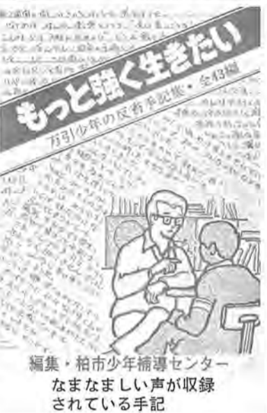
編集・柏市少年補導センター なまなましい声が収録されている手記

昭和四十八年に完成した柏駅東口再開発事業。これによって、柏市は周辺市町村から消費人口の流入を招き、東葛地方の中核的商業都市として大きく変わりました。しかし、この急激な人口増と消費人口流入は、一方では都市基盤の形成に貢献していますが、他方では繁華街化、享樂施設の増加などをもたらし、補導件数が増えるなど青少年に限ると大きな問題を抱えています。