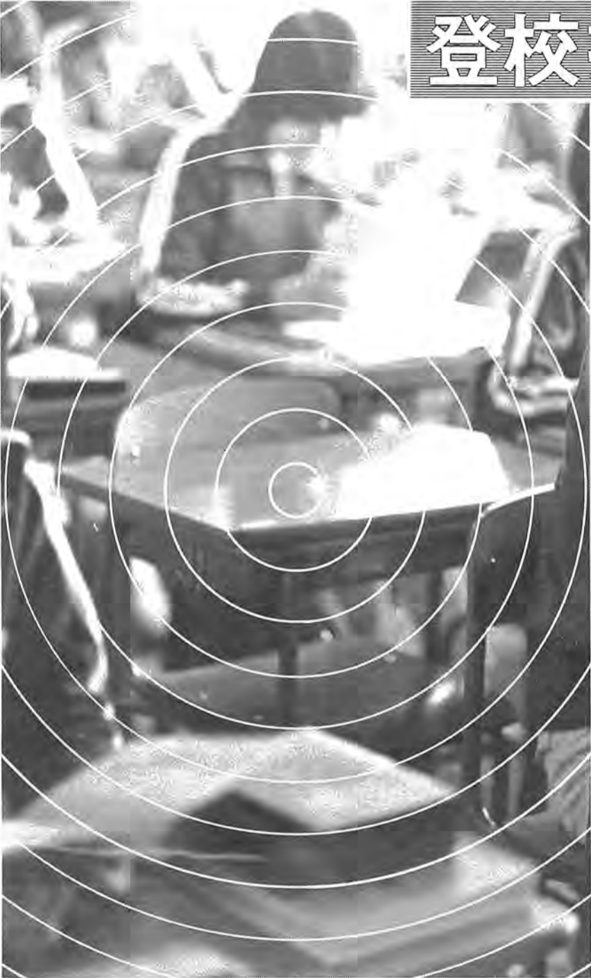
休み明けになると、空席が目立ち始める...

新しい学校、クラス替えなど緊張の続いた四月の新学期。ようやく学校生活に慣れ始めてきます。しかし、どうしても新しい環境に適応できない子どもがいることも事実です。 五月の連休明けの時期になると児童、生徒の病気による長期間の欠席や怠学、理由が明らかでない欠席などが急激に増加する傾向にあります。 市内の昨年度の小・中学校の長期欠席者はおよそ百四十人。そのうち腎臓疾患、精神病、神経症、身体虚弱、血液・造血器の疾患などの難病による原因で欠席している児童、生徒は約百人。残りの約四十人は、家庭の事情、本人の怠学、あるいは理由がなく欠席している児童生徒です。