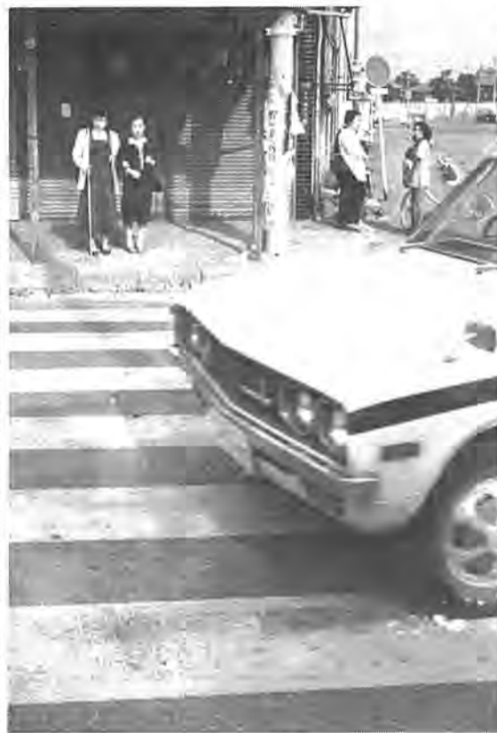
盲人に安心感を持って街に出てもらう この制度への期待は大きい

市では、目の不自由な方が外出する場合、その安全を図るため、今年度から市独自で「盲人ガイドヘルパー制度」を実施することになりました。 この制度は、盲人の方が買い物や冠婚葬祭への出席、市役所などでのいろいろな手続きなど、日常生活に必要な事で外出する時にヘルパーが同行し、盲人の安全を確保すると、盲人に困難な手続きなどを代行したりするものです。市内には目の不自由な方は約二百人。そのうち一人で外出するところが困難な方は約百二十人といわれています。これらの人は、外に出るにしても街の中では様々な危険にさらされているのが実情。ヘルパー制度は、県でも五十年前から視覚障害者愛の友協会に委託して行っていますが、派遣に日数がかかるなど不便な点もありました。 市が進めようとするこの制度の特徴は、盲人世帯や盲人単身世帯にヘルパー派遣が簡単にできるという専任のヘルパーを付けることにあるとあります（マンツーマン方式）。また、目の見える方と同居する夫婦も盲人世帯のAさんは、「長年待ち望んでいたこの制度を画期的ともいえる方法で、市が実際に踏み切られたことは、非常に有り難い。学校の保護者会なども安心して参加できますね」と大喜び。また単身のBさんは「音楽、