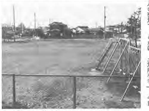
のびのびと遊べる千代田二丁目の児童公園

○手続きの方法と使用料 市役所市民課、または市役所各出張所窓口で、死亡届を提出するときに申し込まれます。使用料は、祭壇の運搬や組み立て、返却など一切を利用者が行う場合は、三日以内で三千元、一日増すごとに千円が加算されます。