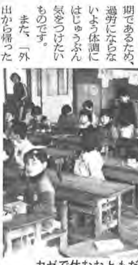
カゼで休むおともだちも増えていきます(1月25日土小学校で)

気温が下がり、カラカラという悪環境の中、特に受験生は特に気をつけて、「睡眠を十分にとる」というカゼひき止めの心がけが大切です。