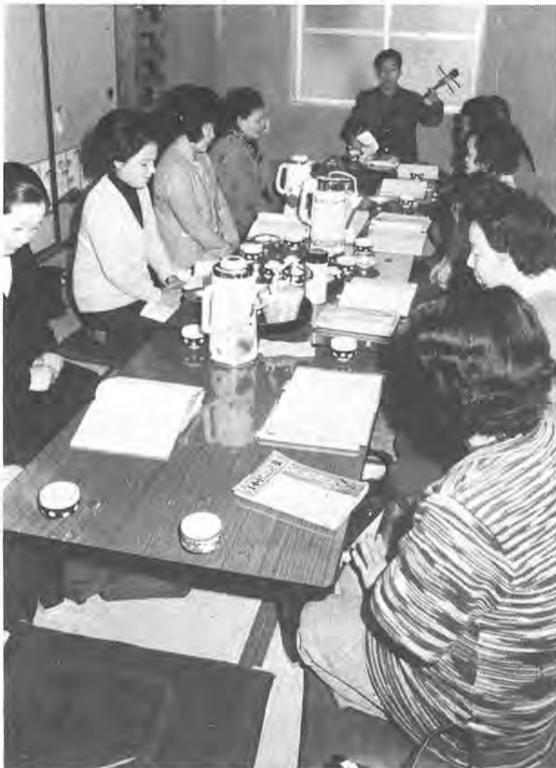
「ハーヨーイヨイ」センターは、民謡の練習などにも盛んに利用されています

浅いこの施策、利用者の一部からは「夜間も使えるように欲しい」「図書室に大人向けの本も」などの声が寄せられています。市では、五十三年度で新たに市内二カ所にセンターの建設を計画していますが、こうした利用者の声を参考に、より親しまれるセンターを建設していくことにしています。