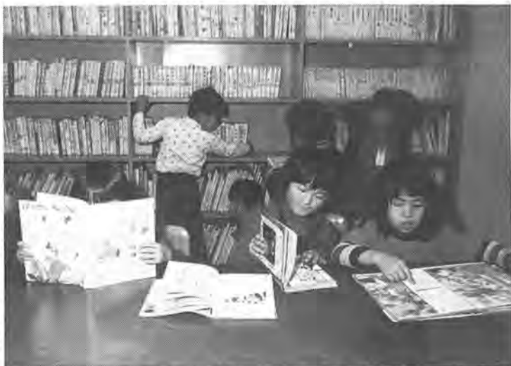
ミニ子ども図書館、ともいえる図書室。日曜日にはよい子がたくさん訪れます