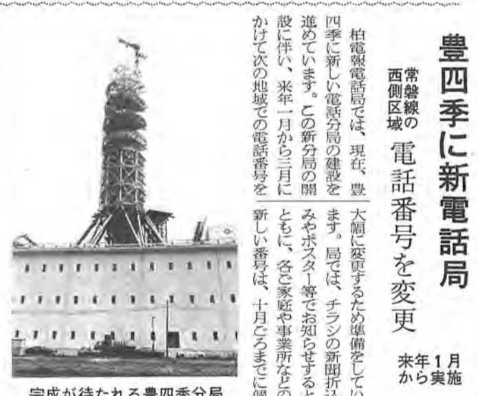
完成が待たれる豊四季分局