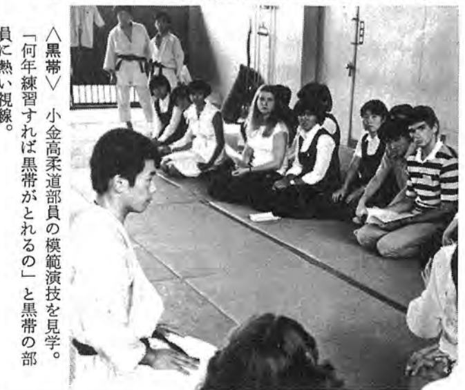
〈黒帯〉 小金高柔道部員の模範演技を見学。「何年練習すれば黒帯がとれるの」と黒帯の部に熱い視線。

〈歓迎会〉 ト市学生の歓迎会に、今年の柏からの派遣生や、民泊提供者など約百八十人が参加。「柏は美しい樹々が多く、水が大変おいしいです」などと印象を語ったあと、八人で自慢のノドを披露。