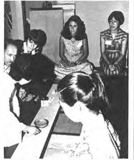
〈茶道教室〉 おじぎの仕方や飲み方を習ったあと、順番に一服。一人の学生が「なんで、茶碗は回して飲むの」と鋭い質問。