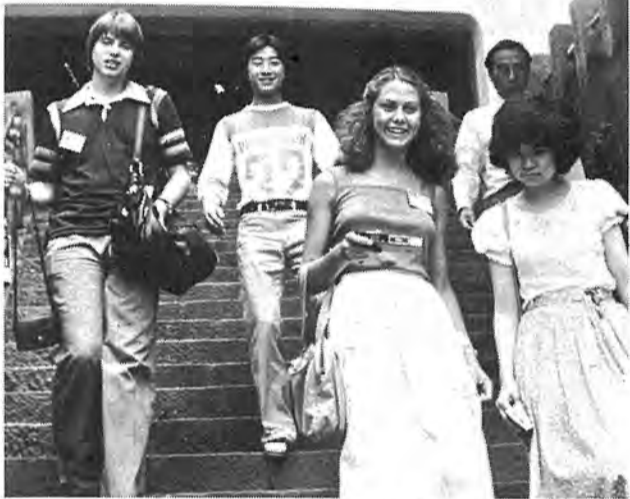
〈布施弁天〉 柏の名刹布施弁天。若い住職から英語で寺の歴史や弁天開帳などの話を聞き、しばし納得。