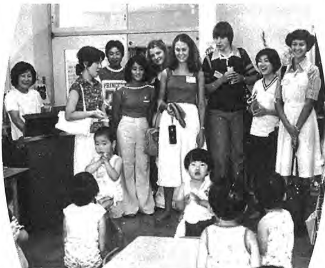
〈乳児保育園〉 ゼロ歳児など百人近い園児をあずかる豊四季乳児保育園。園児たちは、ト市学生を歌で歓迎。