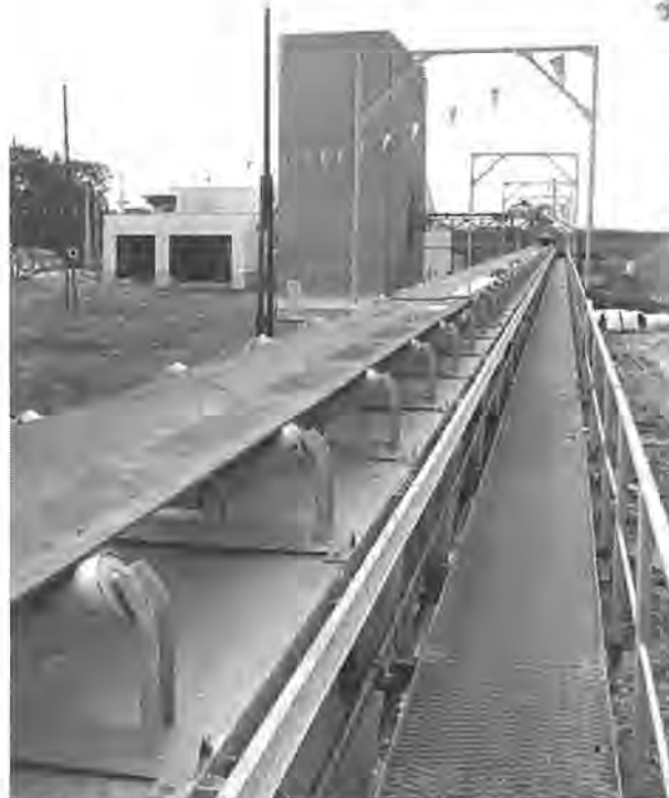
分類した燃えるゴミを焼却炉に運ぶベルトコンベヤー

柏市では、増え続ける燃えないゴミに対処するため、今年一月から船戸の清掃工場内に破砕施設を建設していましたが、ほぼ完成し、八月十日から試運転を開始することになりました。この破砕施設は、家具や自転車などの燃えないゴミを細かく破砕し、鉄分などは資源として再利用をはかるとともに、埋め立てるゴミの量を少なくして、確保が困難になってきた埋め立て地の有効利用をはかろうとするものです。この施設の完成によって、同工場は、現在運転中の焼却炉二基と併わせ、現在考えられる機械的ゴミ処理施設のすべてが整えられました。