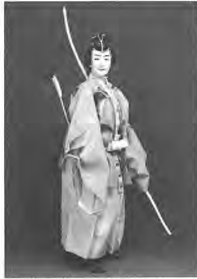
花柳寿輔 (小袖曾我より)

夏の疲れをいやしてくれるのはなんといっても「芸術の秋」。今年も音楽・演劇・映画などの楽しい催しがこの秋には各地で予定されています。