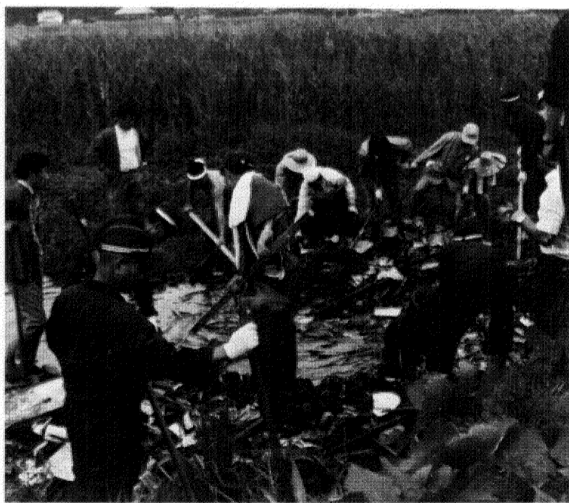
こんなにゴミでいっぱい「だもん手賀沼は汚れるなあ——」。取り組む市民もしばしばうぜん