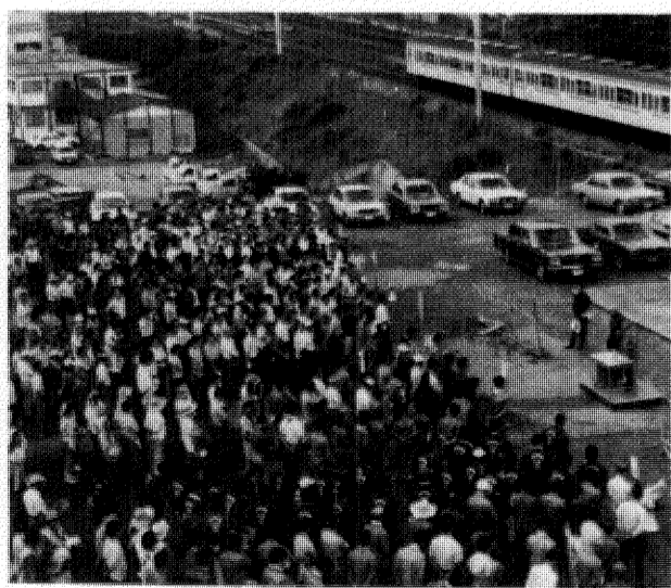
いざ出陣、600人が同一目的の作業に。柏市はじまって以来の「市民参加」でもあった