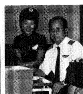
「南十字星が輝く星空、雨あがりの緑にもえた大地、それはとても美しいものです」とも