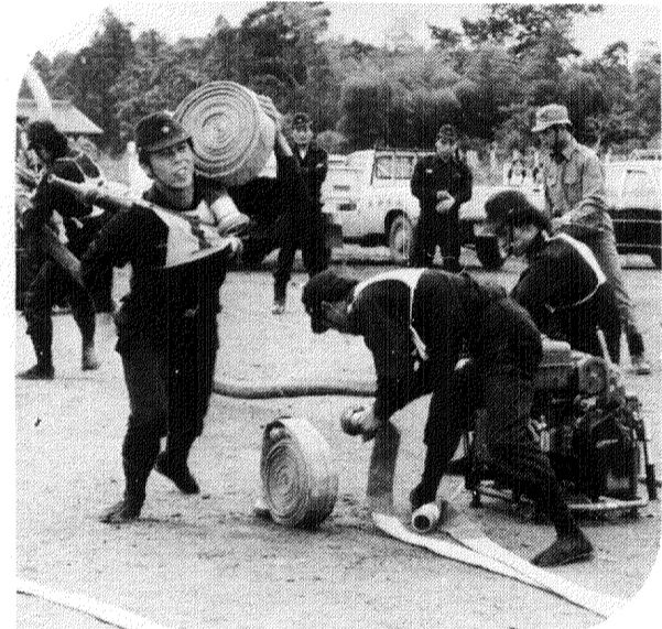
いまま。 なお、当日雨天の場合は十八日に順延されます。詳しくは勤労青少年ホーム(31-6098)へお問い合わせ下さい。

市内全域の青少年が一堂に集まり、お互いの交流を図るチャンスはこれまでなかなか実現をみせませんでした。今回初めてそれが実現することになりました。 七月十七日の土曜日、午後六時から九時までの三時間にわたり、柏公園入口の柏そごう第五駐車場で行われる「若人の集い」がそれです。 これは若人の集い実行委員会、柏市勤労青少年ホーム育成会、柏青年会議所、柏市連合青年団など十二団体の共催により、盆踊りやフォークダンスを通して、市内勤労青少年、青少年関係団体の交流を深め、よりよい仲間づくりを推進しようとするもの。当日は一日