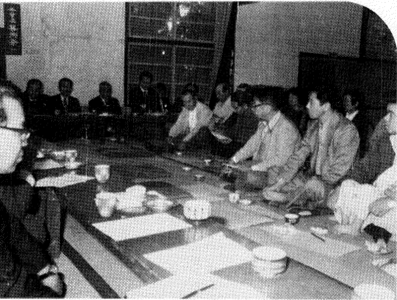
団地開発に伴う周辺の整備を強く訴える花野井地区の住民(15日花野井公会堂で)

○田中農協付近に信号機を、また花野井木戸にあるのは故障しているようですが、現在、市内七十三カ所に信号機が設けられています。ご要望の場所は、五十七