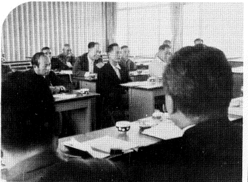
都市化による深刻な農業について話し合う大室地区の住民(16日田中農協で)

設けられるよう要請します。東急が花野井と大室地区に計画している団地計画と周辺の下水道対策は、東急不動産では、六十四の用地買収もほぼ終わり当初五十二年三月までに造成したいと考えていたが、各種の事情により五十四、五年ごろと予想されます。これにあわせて、花野井木戸から若柴交差点までの道路を十六号に拡張し、歩道を設けるなど整備していく考えです。さらに、周辺の雨水、汚水の対策について