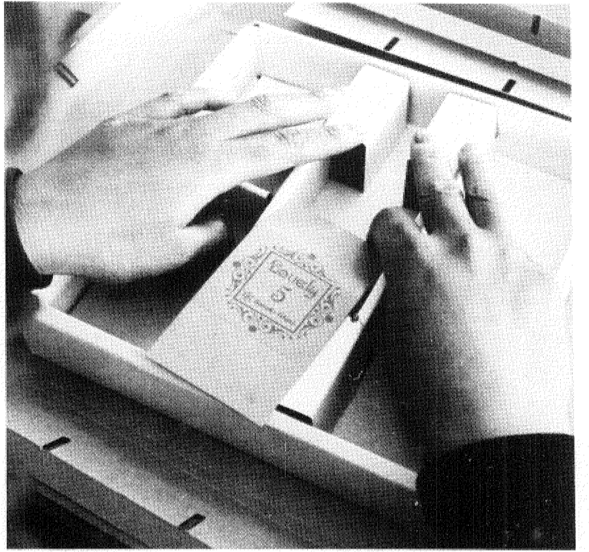
この手の動き...4年間の訓練の成果で、厚紙は正確に折りまげられ、箱が作られていく。今では作業動作もスムーズで、表情にも自信が伺える。

昨年六月市内十余に開園し た、知恵の遅れた人の通園訓練 施設「青和園」では、現在、身 の回りの整理が自分でできる中