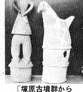
「塚原古墳群から出土した埴輪」

さて今回は、古代の遺跡のうち、古墳にスポットをあててみましょう。古墳は三世紀から七世紀にわたってつくられたお墓で