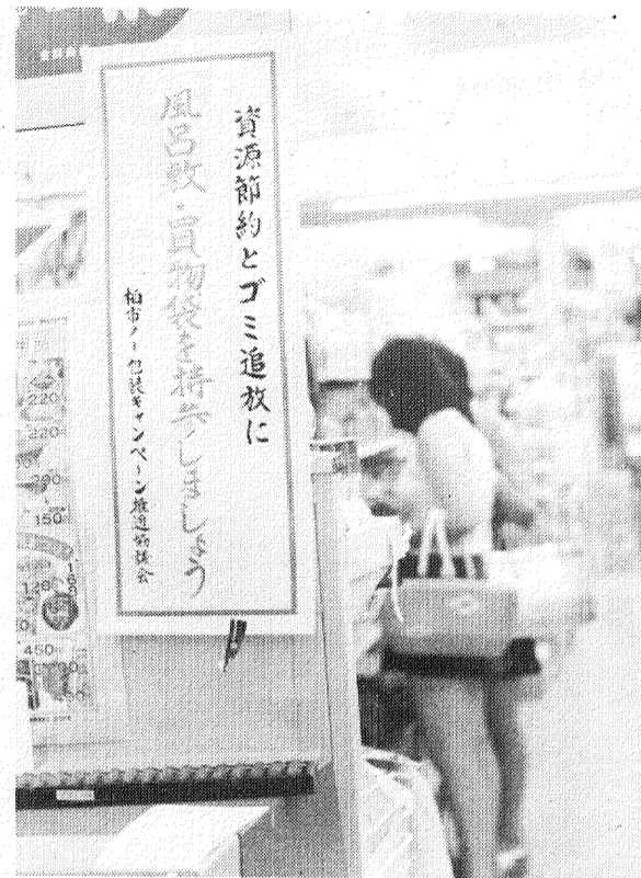
買物客に包み物持参を呼びかけた店内のポスター

昨年来の資源不足を契機にして、世界的にも限りある資源を有効に使うという機運が、高まってきました。そこで柏市でも、紙資源の有効利用とゴミの減量を目的として、去る五月二十四日に「柏市ノ一包装キャンペーン推進協議会」を結成し、協議を重ねてきました。協議会は、消費者代表、商店会代表及び市で構成され、これまでの協議内容では、ノ一包装キャンペーンポスターを店頭に表示することや、大型店では買物袋に防水加工を施し、ゴミ袋として再利用できるようにするなど、着々と準備を進めています。さらには、包装紙にかかる経費の削減に伴う利益を、消費者に直接的に還元する方法も取り入れるよう、検討していくことになっています。 この運動は、全市民的なキャンペーンとして取り入れていきますので、市民の皆様にもこの趣旨をご理解していただき、買物の際にはふろしきや買物袋を持参し、この運動にご協力をお願いします。