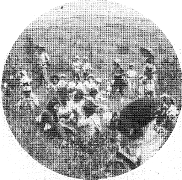
菅平高原に憩う (昨年の市民ハイキングから)

過密、雑踏の都会を離れ、大きな自然のふもとで心ゆくまでスポーツを楽しみたい。そんな「菅平高原」で、 かたのために、市教育委員会の主催による、豊かな自然環境に恵まれた長野県「菅平高原」で、