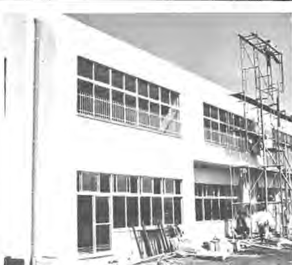
4月1日開園めざして工事が進む豊住保育園

豊住保育園 四月開設へ 本年度の学校建設は、藤心小と南中を新設。藤心小は児童数三百四十六人で、南中は生徒数二百七十一人で、いずれも四月五日に入学式を迎えます。豊住三丁目に建設した豊住保育園は、四月一日開園。定員は百二十人、現在は入園希望の中から選考中。これで市内の保育園数は八園となります。 ○老人福祉センター 市内船戸の清掃工場に隣接、お年寄りに利用しやすいよう平家建、鉄筋コンクリート。延面積千五百九十九平方メートル、総事業費一億五千万