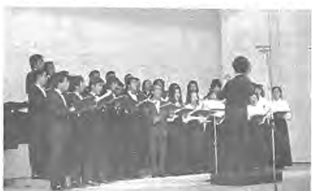
市民文化会館で発表会を行う市民合唱団のメンバーたち。

「合唱の魅力は」とお伺いしたら「自分の声全体の中で、スーッと一本のハーモニーになる。たまらないですね」。「やっ」といふ人にも、わかんなかぬ。窓の外を見あげて、ホッとひと息。「今の時代は思いきり大きな声を出す機会