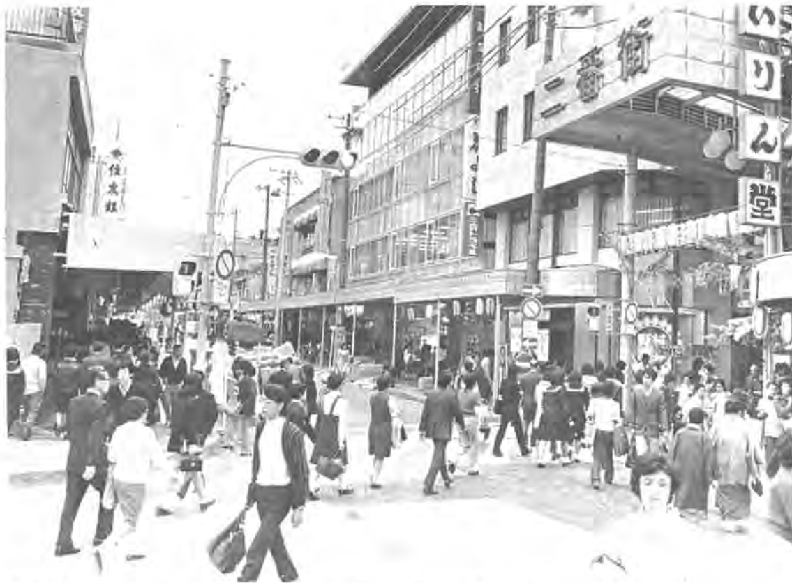
周辺商店街に必要なのは、新しい消費者を手元にひきつける商業方針です