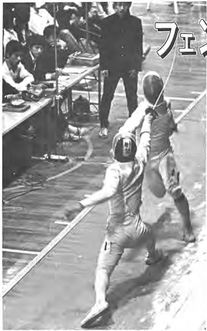
千葉県の手層のあつさと実力を発揮した全日本フェンシング選手権大会の熱戦から