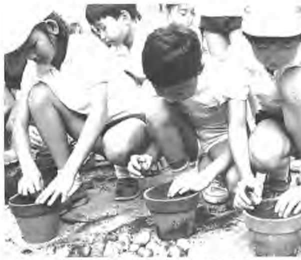
きれいなチューリップを咲かせようと球根を植える光ヶ丘小のお友だち