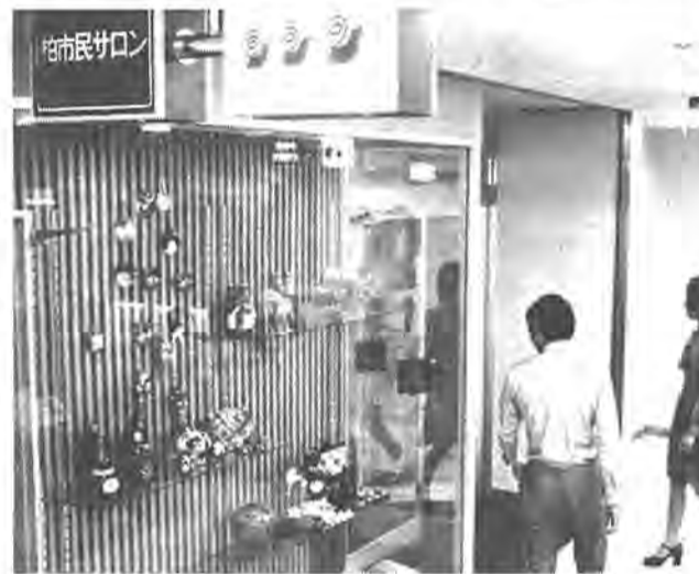
「柏市民サロン」は駅前の新しいビルで、あなたの利用を待っています

市では、増加する乳児保育の要望にこたえ、一般家庭で保育してもらおう「家庭保育制度」を近く始めることになりました。このため次のように、保育してもらいたい乳児(委託保育児)と、保育のできる主婦(家庭保育福祉員)を募集しています。申し込み用紙、そ ママさん 見 募集 市では、増加する乳児保育の要望にこたえ、一般家庭で保育してもらおう「家庭保育制度」を近く始めることになりました。このため次のように、保育してもらいたい乳児(委託保育児)と、保育のできる主婦(家庭保育福祉員)を募集しています。申し込み用紙、そ