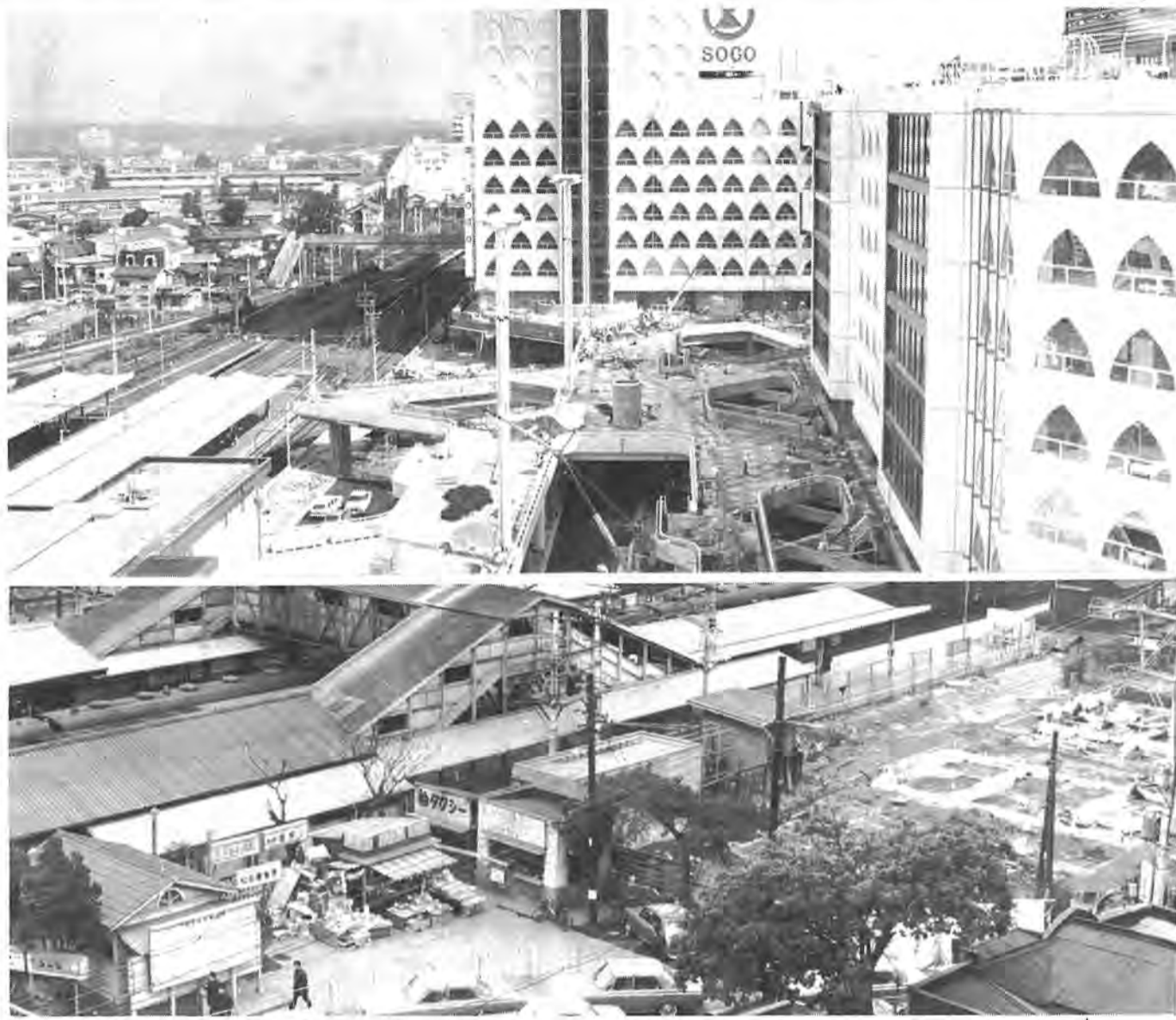
近代的な表玄関に生まれかわった柏駅東口(上)=9月25日撮影=と昭和44年1月ごろの同駅周辺(下)