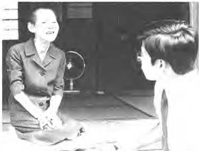
お年寄りの安否も気ずかって5月からは老人福祉パトロールも行なわれています

市ではこの日、九十歳以上のかた三十六名を市長、助役、収入役が訪問して長寿を祝い激励的、労力的な気がねからでているものと思われま