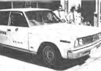
少年補導センターにおくられたライトバン

原産婦人科 (緑ヶ丘・67-1380) ○二十三日 ○井上内科 (今谷上町・67-12817) 科 (今谷上町・67-12817) ○望月外科 (南柏・67-13352) 二七) ○長島産婦人科 (今谷上町・67-14910) ▼三十 日 ○大野内科小児科 (向原町