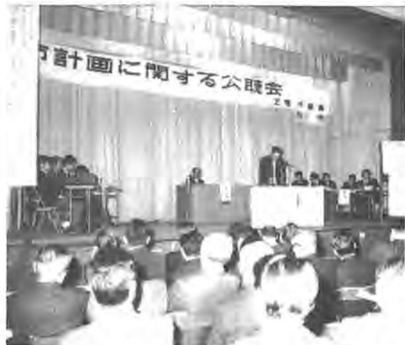
生活に密接なつながりをもつ都市計画案は、公聴会の公述や陳情、要望などをもとで調整されたものです

素案を一部変更 今回の縦覧では、素案で示された市街化区域と市街化調整区域の変更は今回行ないませんが、新たに防火地域と準防火地域が変更されています。防火地域については、現防火地域と六百%以上の容積率を指定する商業地域を指定。準防火地域については、現準防火地域と近隣商業地域および容積率四百%の商業地域を指定しています。用途地域案で素案と変わった主なものは、旭町周辺の第二種住居専用地域と谷上町周辺の第二種住居専用地域が第一種住居専用地域に変わり、本町通り、銀座通り商店街の近隣商業地域が商業地域となつています。また東町通り商店街が住居地域から近隣商業地域に変わりました。