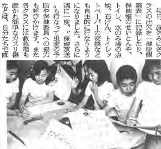
毎日、保健室で「健康観察表」に出欠を記録する酒井根小のお友だち

極的に活動しています。酒井根小は四十六年開校と同時に保健の研究校に指定されました。それ