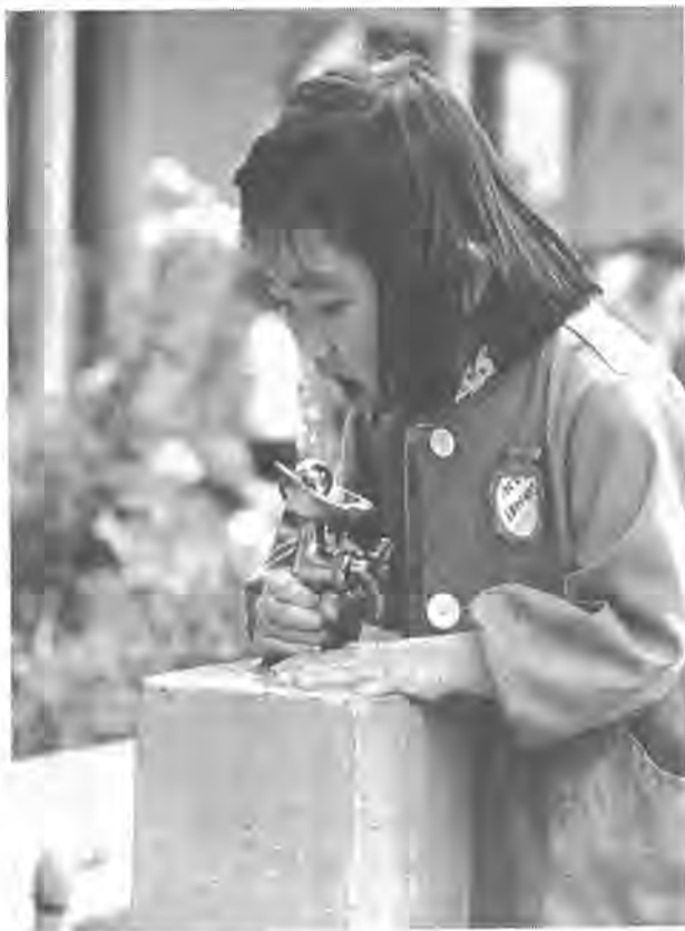
水はどこでも利用されます……大切に使いましょう

着手が遅れていた第五水源地は日本住宅公団北柏団地区画整理事業区域内に予定し、区画整理事業も認可されたので、いよいよ着手