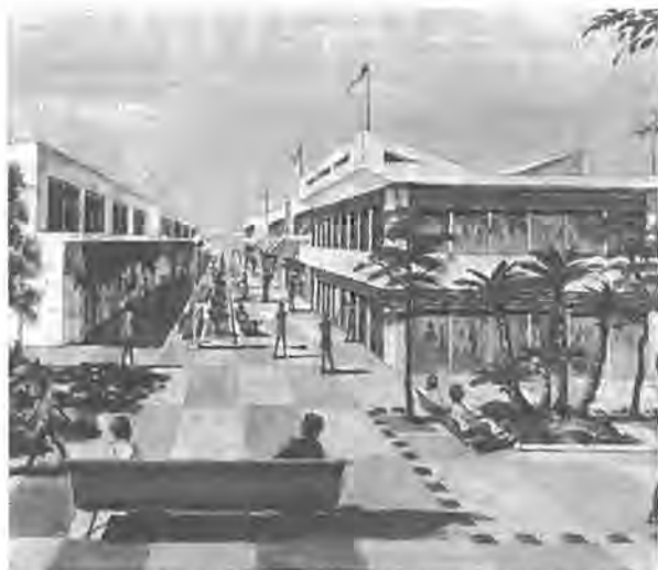
団地のほぼ中央には商業施設や銀行、郵便局などの施設が集中した「地区センター」が設けられます