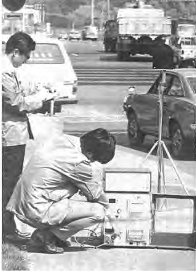
住みよい環境を守るため地道な活動は続く (16号騒音測定から)