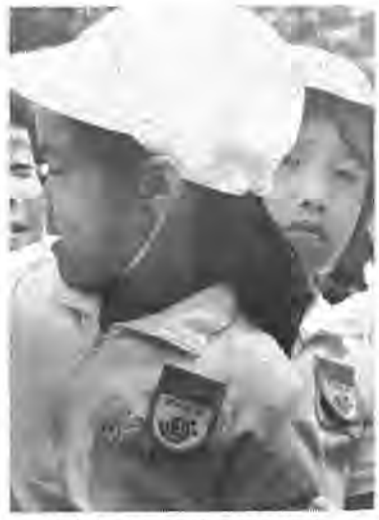
お友だちの胸につけられたあざやかなワッペン

3日 「洋菜鑑賞会」午後一時～午後五時 主催柏市文化連盟・柏市教育委員会 入場自由