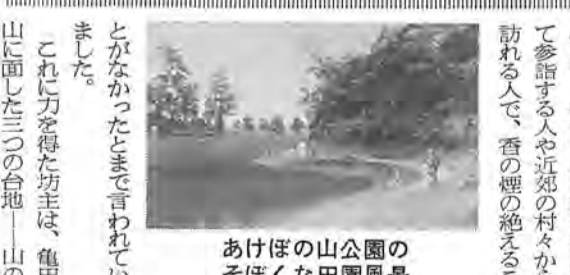
あけぼの山公園の風景

あけぼの山 江戸時代の布施村の絵図面に「臨眺亭」と名づけられた、二間四方の小さな茶屋の庵が記されています。そこは、春の桜や藤、秋のかえどと四季おりの景観を臨む台地で、曙山とも呼ばれています。