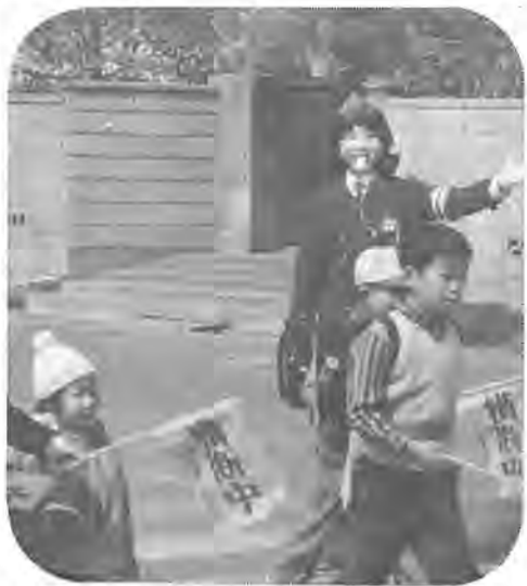
もうすぐ新入学、児童の安全を守る婦交員

「春の全国交通安全運動」は、四月六日から十五日までの十日間、歩行者の安全を重点に、特に新入学生児童と関係、そして幼児の事故防止に力が注がれます。柏市の交通事故の現状は、昭和四十五年九百八十一件、四十六年には九百八十八件、四十七年は八百四十四件と、発生件数では、わずかに減少の傾向にあります。死者については四十五年に二十四人、四十六年に二十一人、四十七年には二十人、ほぼ横ばいの状態を示しています。