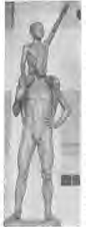
市文化センターの「次代の二人」の文芸展に出品された市民の作品