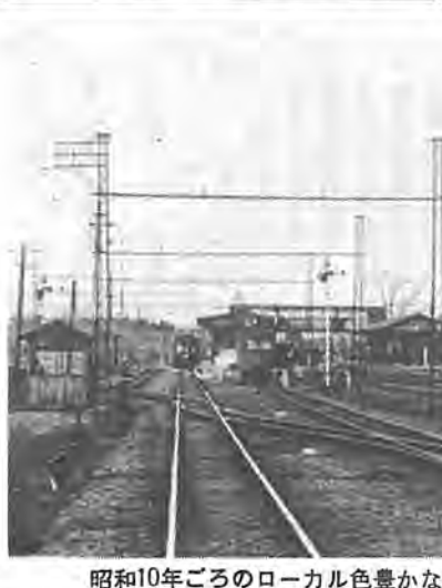
昭和10年ごろのローカル色豊かな柏駅

市議会 九月十一日から第三回定例市議会が始まった。一般質問は、総合計画の改訂、南相区