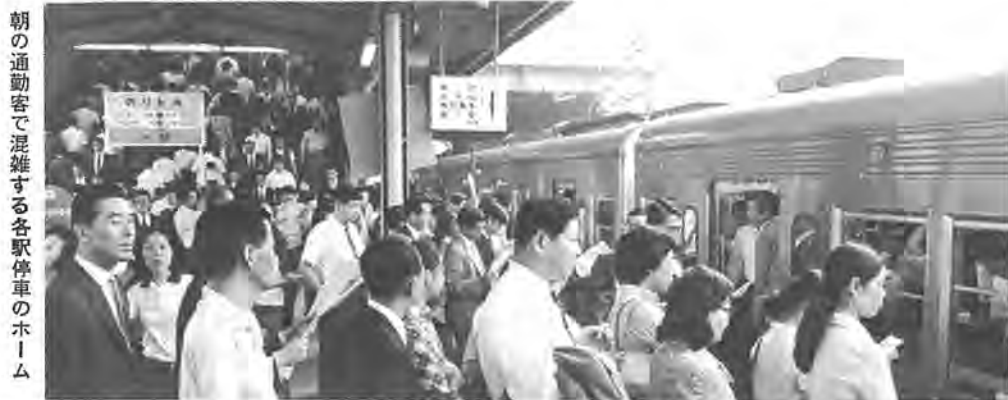
朝の通勤客で混雑する各駅停車のホーム

柏市は、これまで都心へ一時間の通勤距離にあるということからただ東京のベッドタウンとして発展してきました。それが、ここ数年の間に銀行や大型商業ビルの建設ラッシュが続き、いよいよ東北の中心商業都市として発展することが期待されるようになりました。