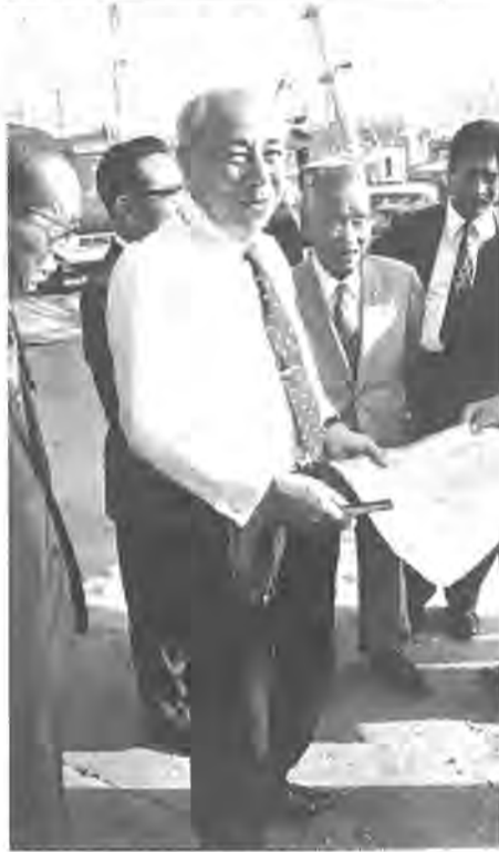
市長から説明を聞く知事

柏駅東口の再開発は、将来柏の発展を促しているといわれるほどの事業。この工事の進み