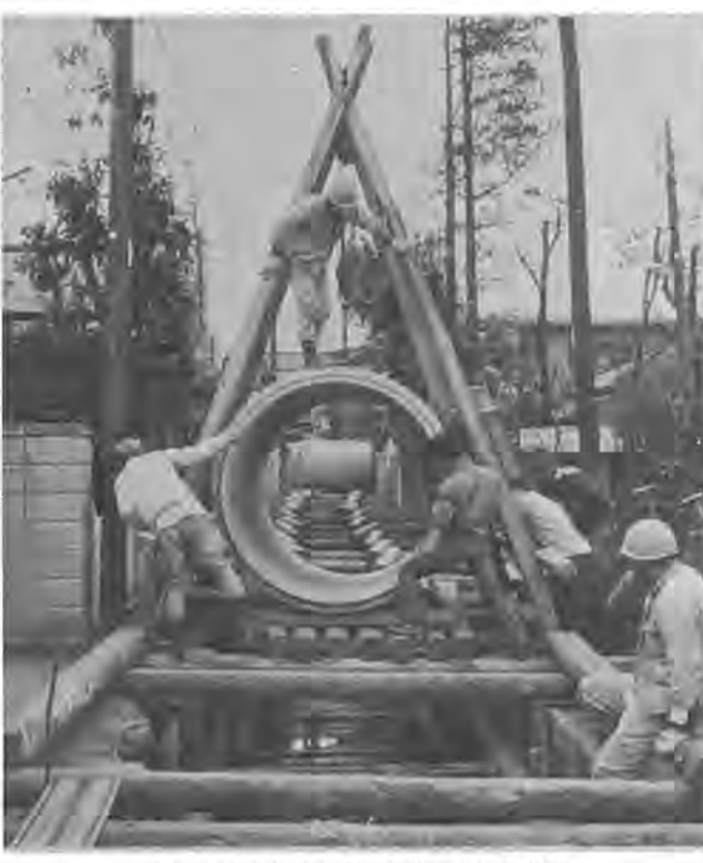
住みよい環境づくりに公共下水道の整備

十八日午前七時、知事が柏駅東口の再開発事業を視察する。市庁舎に隣接する東葛物産株式会社所有の市場跡地を、庁舎の増築にそなえ、買収するための財源の取得とこれに伴う補正予算を提案した。本庁舎付近は、庁舎を建設した当時、民家もまばらであったが、現在はほぼ