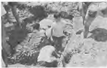
白い貝層をていねいに掘り起こす

利根運河の貝層発掘調査が、八月八日から十一日まで行なわれ、約三万年前の貝が約三百種、そのほかコブシガニの化石一種が発掘されました。