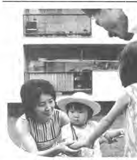
豊かな家庭は住みよい環境から