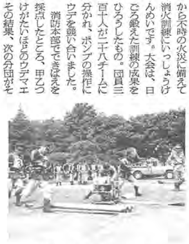
優勝チームは県大会出場へ

さる二日、つゆの晴れ間の柏公園で第十回柏市消防団操法大会が行なわれました。市内十二の消防団では、ふたたび優勝チームは県大会出場へ