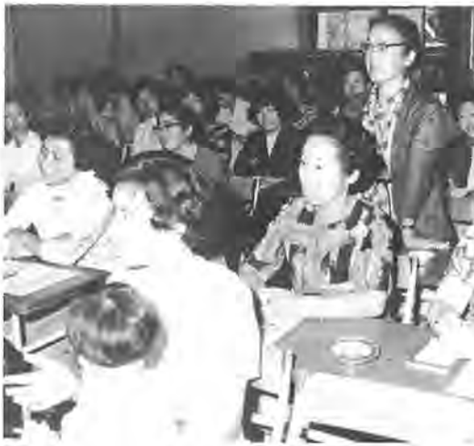
商品の表示はわかりやすく と消費生活モニター

袋詰めの商品は百グラム単位で表示して一さる六月二十八日商工会館ホールで開催された市と柏商工会議所主催「消費者と経営者の懇談会」で消費者のお母さんから出た要望のひとつでした。この懇談会では、日常生活に必要な商品や商品のサービスなど経営者にとって望ましい姿を求めようと、消費者側から市が委嘱した消費生活センターとモニター経験者、連合婦人会員の四十名が参加。また商店側から市内商店主二十一名と県消費生活センター所長と柏保健所衛生課長が出席、青果、食肉、めん類などを食料品トレーマをまわって討論が行なわれました。