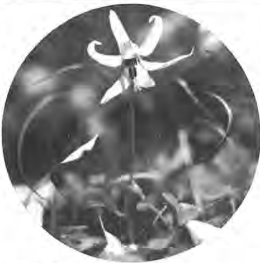
十五センチほどのクキにあわい紫色の花をつけたカクタクリ

市文化財に指定されているカクタクリが、ことしも薄紫色の花を咲かせました。 球根を粉にして食用にしたと、このカクタクリの花、木々の間を這うカクタクリは、現在、都からこぼれる目を受けて山はた市近郊の自生地では県下唯一の一面に咲いています。