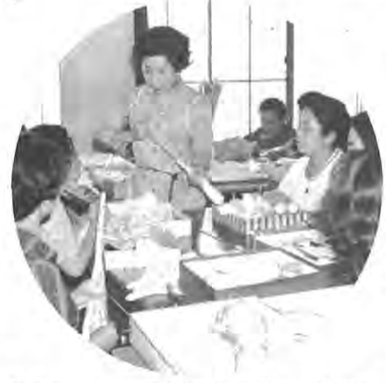
整った環境の中で楽しみながら学ぶお母さんがた 成人学校の日本人形作り