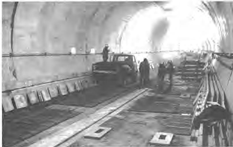
着々と進む千代田線延長工事(国会議事堂付近)

快速電車の柏駅停車は、長年にわたる市の運動と市民の皆さんの熱烈な支援によって昨年十二月正式に決定され、同月下旬から工事に着手されました。