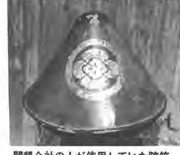
開墾会社が使用していた陣笠

その後の開墾がはじめられたわけですが、彼らもこの地の状況は一度の調査で承知していたし、それ相応の覚悟はしていたのでしようが、あまりの荒涼さ(荒涼さ)を目撃したことでしよ。 今まで牧場であったこの地も、つい先日すべての馬が捕えられ、または他の地域へ追いつめられ、馬の姿を見つけたことは、きませんが、そこに広がる景色は牧場であったこととまるで違っていました。 そこには、草が打ち打ちの中に空木などの灌木が生い繁る見渡すかぎり、のびやかな草原が広がっていたのですから、はなやかな「江戸」で育ってきた彼らには、緑を失った一面の枯野をながめては、これからの開墾の困難さを感じ、暗たるる気持であったろうと思えます。 この荒れはた章