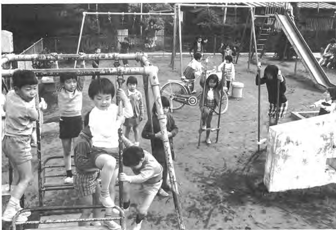
「チビツ子天国」で元気に遊ぶよい子(あかね町)子どもの遊び場で

市では皆さんからのご連絡を待つだけでなく、必要な調査をしたり、すでに取り付けた遊具の点検を行ない、調査資料を分析し十分な施設をいかにして造るか、真剣に取り組んでいます。