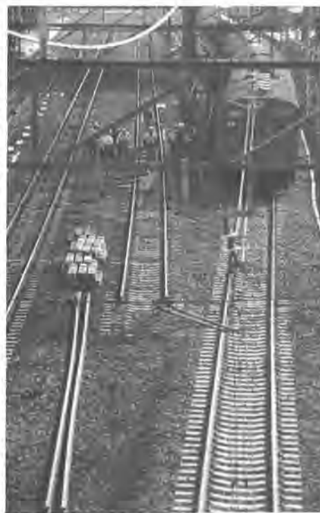
旧線路がとり払われてここに快速停車の新ホームが誕生します

こうした国鉄と地下鉄の輸送力の増強によって、市民の皆さんにより安全、快適に、便利に利用されるものと思われたい。 また商業都市として着々と歩みをつける本市の商業圏が拡大されるとともに、地域開発が進むなか、発展の一途をたどる柏が一層躍進する契機となることでしょう。