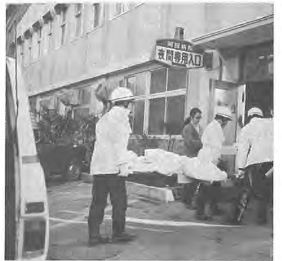
病院に送りどけて