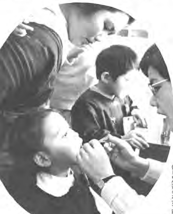
チョッピリ不安顔で歯科の診断を受けるよい子