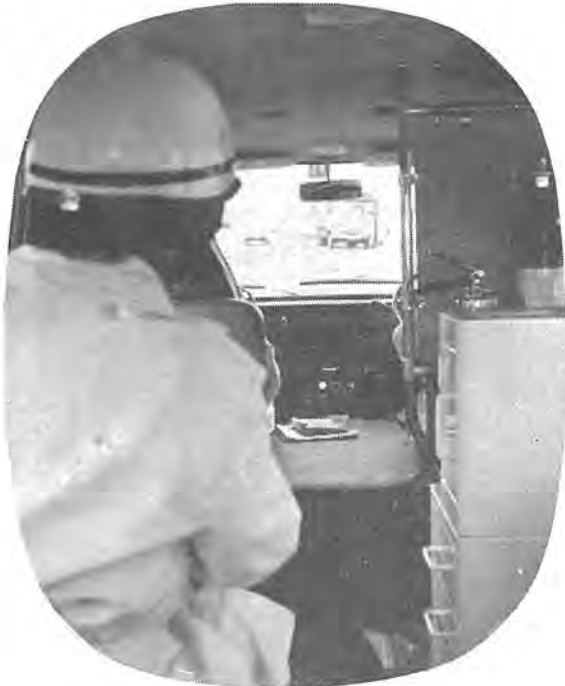
交通渋滞のなかを現場へいそぐ

ど救急備品で応急手当をするのは、現場から病院へ運ぶまでの重要な業務です。 重傷患者を運ぶ時には、急ぐ気持と患者の安全に配慮も欠かせません。 病院につき、看護婦さんの応援で診察室へ運ぶと救急活動の終りが近づきます。 無事病院へ運んだことを通信室と連絡をとると、帰途につきます。 救急隊員は、まだこれからの活動に備えて汚れた救急車のそうじと車輛を点検し、事務報告を終え、またいつ要請があるかわからない出動にそなえて万全を期します。