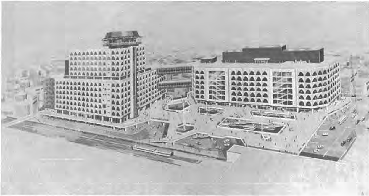
柏駅東口市街地再開発事業完成予想図 駅と再開発ビルなどの二階がむすばれ人専用の広場となります。地上は車専用の駅前広場