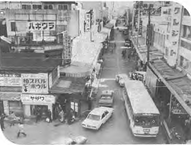
現在の柏駅東口商店街

用された健全な市街地の形成を図るために、市では昨年八月に事業計画を公表し、区域内の地元の方々と話し合いを行なって、土地や建物の価格を決め権利内容の調整にはいりました。