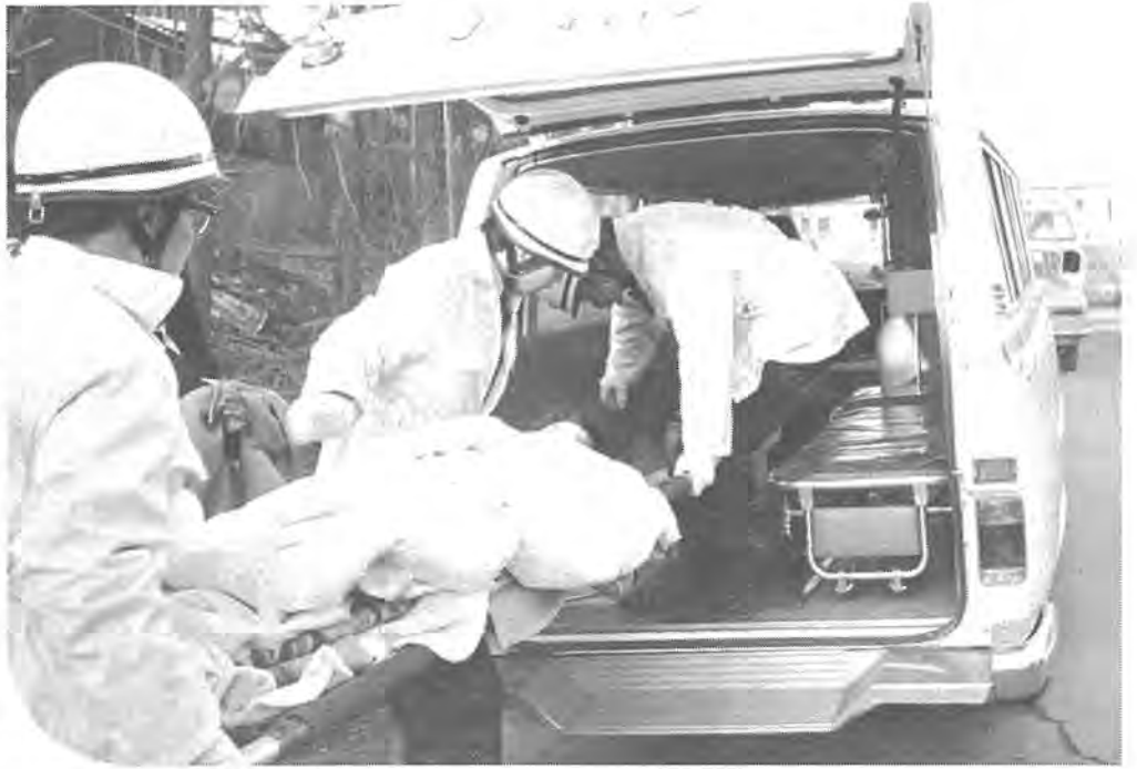
急病人の収容にとりかかる

ピーポーピーポーと赤いランプを点滅させて、きょうも救急車が町へ飛び出て行きます。 急激な人口増と国道六号線、十六号線が市内を縦断する柏市は、車の増加とあいまって、救急車の出動要請もふえる一方です。 昨年の救急出動件数は千九百六十件で、一日平均五回出動したこととなります。 そのうちとくに急病と交通事故の出動回数が多く、全体の七十七パーセントをしめています。 消防署では、このように増加している負傷者や、急病人を一刻も早く病院へと、昼夜兼行で出動態勢をとっています。 今号では、市民の皆さんに市の救急活動を、お知らせしましょう