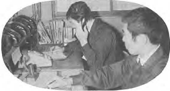
119番を受ける職員(奥)と救急車と緊急連絡をとる職員(手前)