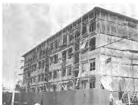
向原に建設中の再開発公共住宅

権利者の土地の明け渡しが完了した時点でビルの建設工事に着工しますが、ことし四月から工事を始め、昭和四十八年九月までには完成する予定です。