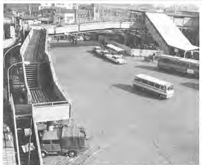
西口広場をまたいでかけられた横断歩道橋