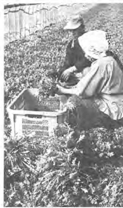
香りのいい春菊はお正月の料理にはかかせないもの。いま市内大室のビニールハウスからみなさんの台所へおくられています。

おひです。該当者にはすでに通知を差し上げてありますが、万一届かない場合は、内線三二四へお問い合わせください。