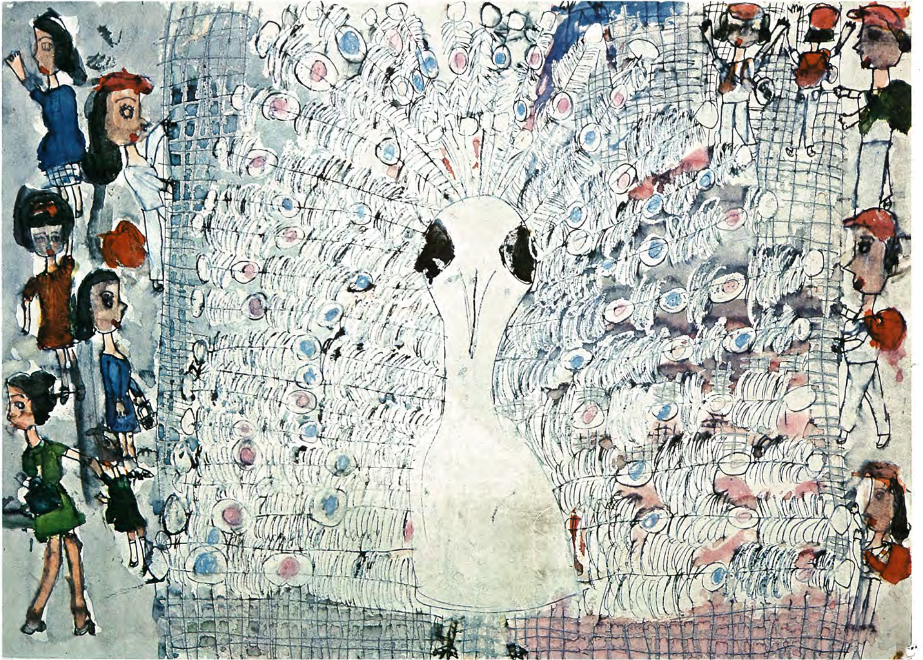
大きく羽根をひろげたくじゃくと未来に向ってばたく「柏っ子」、 あすの柏が象徴されています。

人口 161,193人(前月より+870) 世帯 43,910戸(前月より+259) (46.11.30現在)