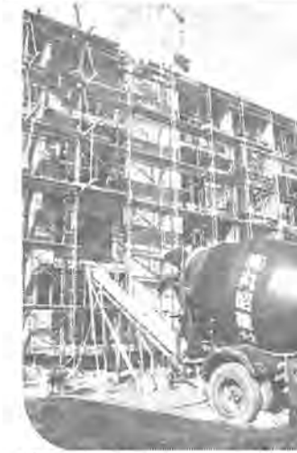
二月完成目指して建設中の市営住宅

○健康診断の内容は、内科検査や歯科検査のほか、簡単な面接などを行います。 ○お子さんには、次の点に注意してください。 ○就学通知書は、健康診断日に必ずご持参ください。 ○おいでになる場合は保護者または、それにかわってかたが必ず付添ってください。 ○お子さんのおもな既往症と、各種の予防接種を受けた年月日が答えられるようにしてください。 ○当日酒気やその他やむをえない事情によって、健康診断を受けられない場合は、そのことを学校にお知らせください。 ○お子さんの衣服や身体は、できるだけ清潔にしてうけてください。 ○うわばきは各自必ずご持参ください。 なお、日程については別表のとおりです。