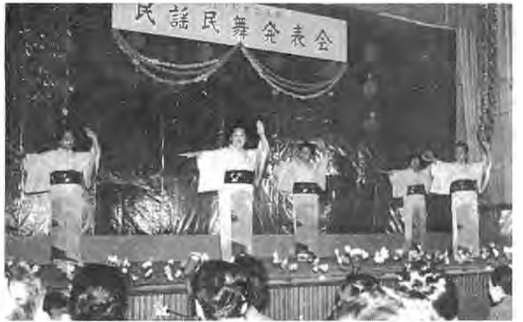
盛況だった昨年の民謡発表会