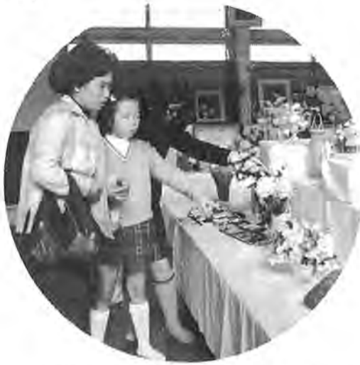
力作が並んだ展覧会場（昨年の文化祭から）