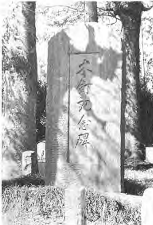
木立にかこまれてひっそりたつ木釘記念碑

がなかったためであると思われまふ。 こうして、豊四季全体に木釘作りの副業が広まり、入植者の有力な現金収入源となつて、それをもつて種や農具を買ひ求め、のり薄田畑のかわりとなつて入植者の生活をささえたものと思われまふ。 木釘はタンスなど桐材の組立てに使われますが、今のようにならなかつたのは、その需要もたへんもので、豊四季の木釘はたちまち有名になり、需要に応じきれないほどあつたといわれています。