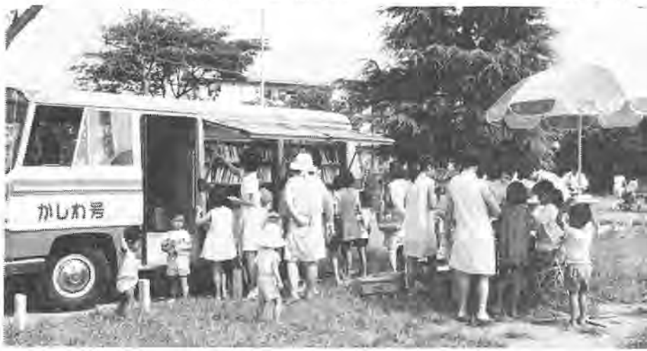
さあ、秋です 読書に親しむよい子たち

市では、明るく充実した柏市を建設するために、きめの細かい「読書」をすすめています。 その中ひとつ、市民のみなさんに喜ばれているのが、八月から活動を始めた動く図書館「かしわ号」です。 この図書館は、市立図書館から離れていて、すぐに読みたい本が手に入らない人たちのために、無料でお手元へ届けるものです。 今号では、主婦のかたやお子さんのための「読書の希望」を運んで走る図書館の一月間の活動状況を紹介します。