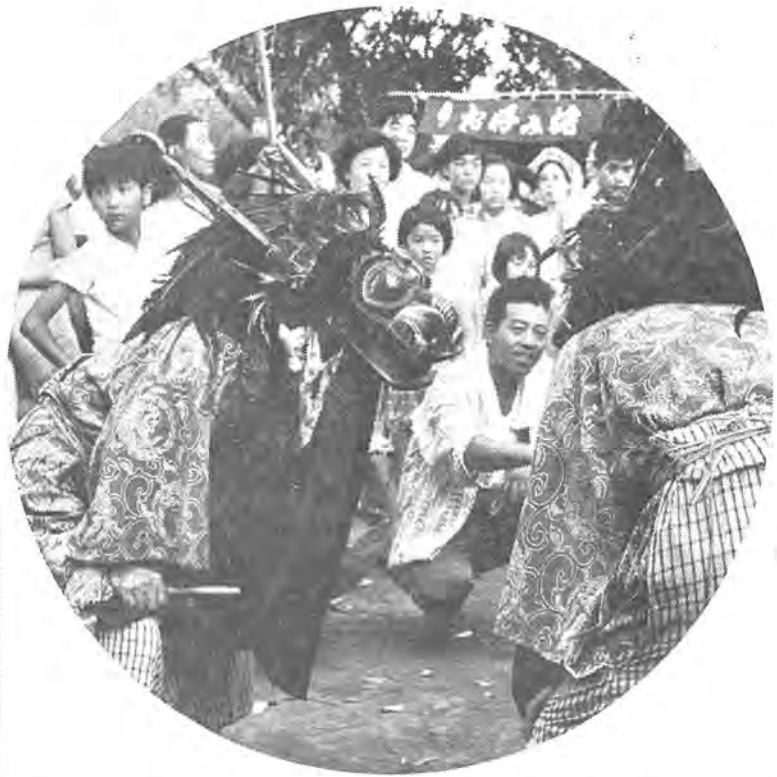
バックパクと口を動かし、激しくゆるく獅子面が躍り、見物人が神妙な顔でまわりをとりまく

ピーヒャラドンと夏祭りに聞こえる笛や太鼓の音色は、子ども心に楽しく、おとなにとつては幼い頃への郷愁を誘われるものです。 今号では、昔から地元の人たちの手でつちかわれ、伝えられてきた柏の郷土芸能、「大室の盆綱」と「篠籠田の三匹獅子舞」を紹介しましょう。