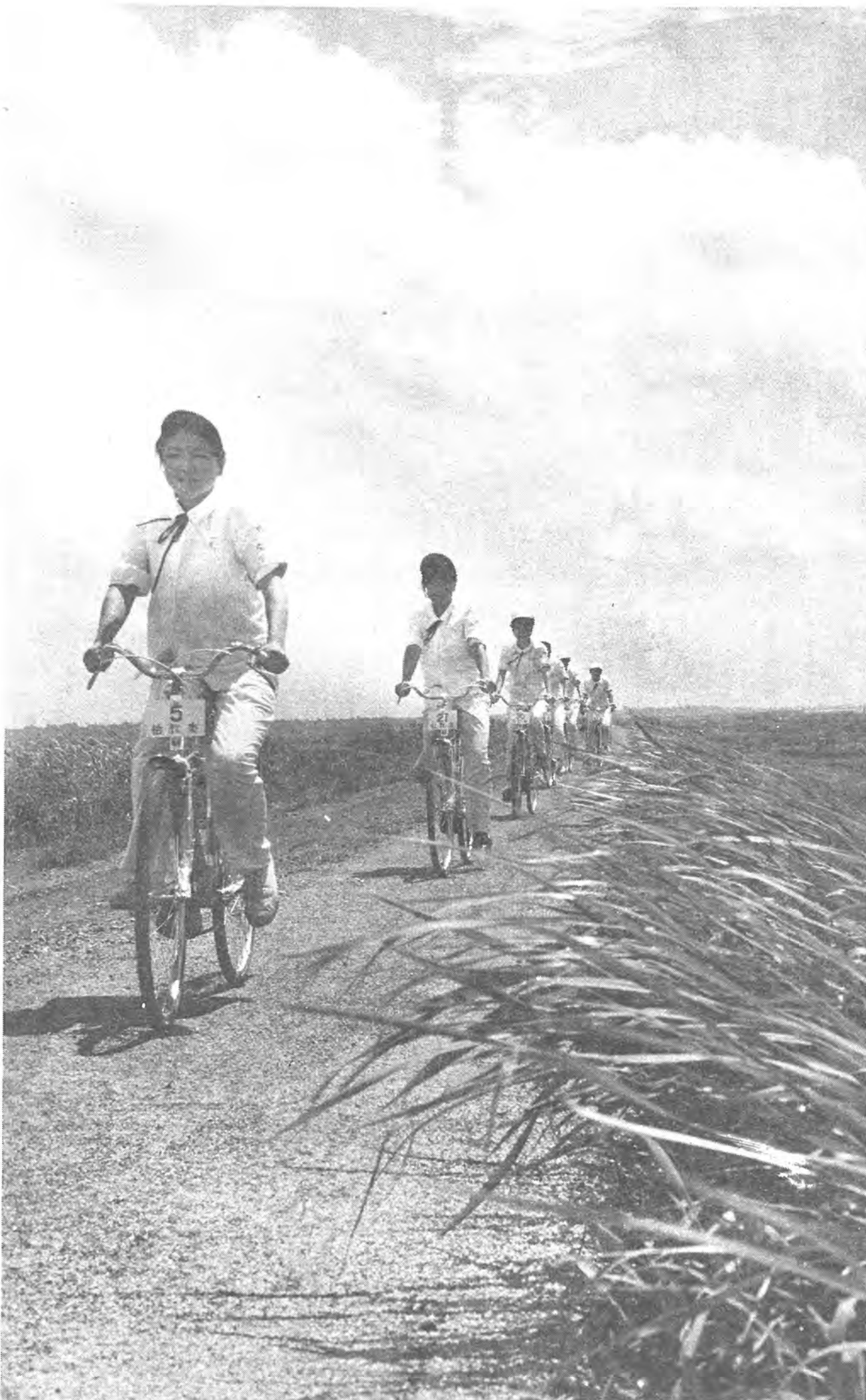
整備された堤防を軽快に「走りぞめ」する富勢中生徒

利根川の清流と、遠くに筑波山が望める利根川堤防に、サイクリングと、ハイキングコースができました。このコースは、市が市民のみなさんに、自然の中で思いきり楽しみ、体力の増進をはかってもらおうと、工事を進めていきましたが、このほど完成したものです。 あけぼの山公園を起点にサイクリングコースは、全長十三キロメートル、ハイキングコースは、五・四キロメートルから七・六キロメートルまでの四つにわかれ、だれにでも利用しやすいようになっています。 これらの付近には、布施弁天や花野井古墳、船戸の医王寺、七里ヶ渡跡などの名所や古跡があり、サイクリングやハイキングには絶好のところです。 サイクリングを楽しむには、あけぼの山公園内の管理事務所利用者カードに記入して自転車を借受けてください。(ハイキングは、自由に利用できます) ○資格 柏市民で小学校四年生以上のかた ○貸出し自転車数 五十台 ○使用料 無料 ○その他 利用するときは交通ルールやきめられたことなどを必ず守ってください。