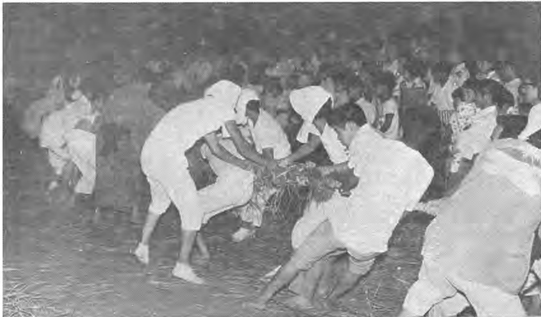
ワッショイ ワッショイと暑さを吹き飛ばす威勢のよいかけ声とともに部落の若者が綱を引き合う

ピーヒャラドンと夏祭りに聞こえる笛や太鼓の音色は、子ども心に楽しく、おとなにとつては幼い頃への郷愁を誘われるものです。 今号では、昔から地元の人たちの手でつちかわれ、伝えられてきた柏の郷土芸能、「大室の盆綱」と「篠籠田の三匹獅子舞」を紹介しましょう。