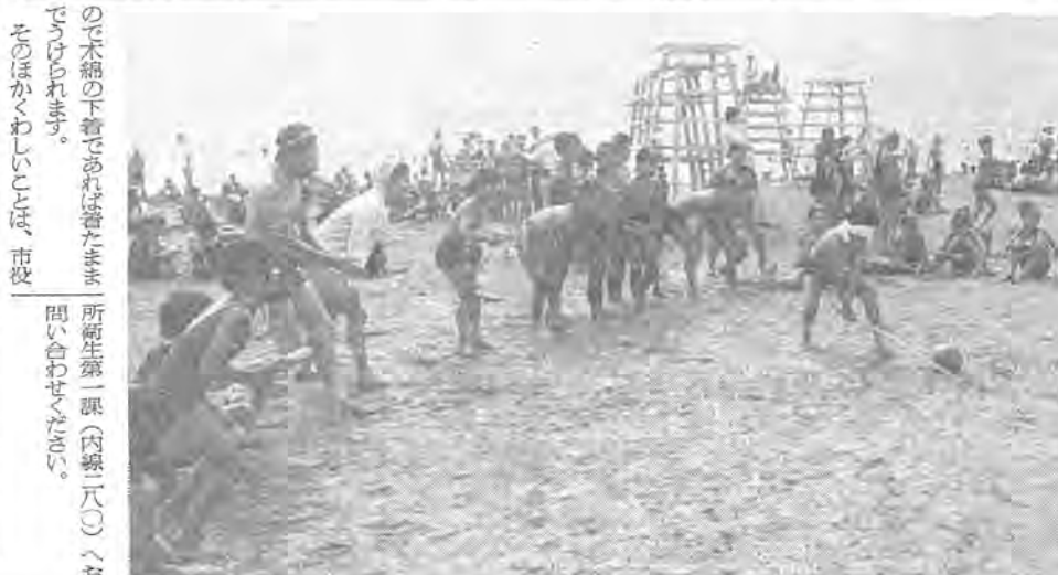
所産牛第一課(内線二八〇)へお問い合わせください。