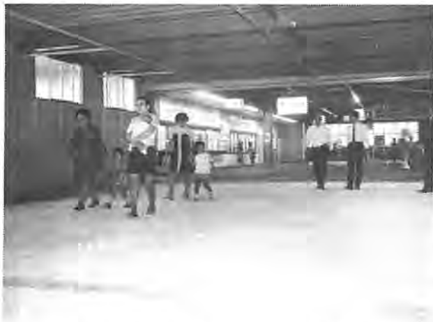
きょうから通れます自由通路

柏駅の橋上駅舎改築にともなう、国鉄と東武鉄道が工事をするため、東口と西口が結ばれました。きょうから、入場券を買わずに自由通路が利用できるようになりました。