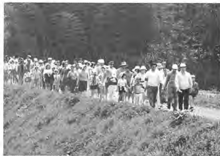
自然に親しみみんなで楽しく歩きましょう

健康な体づくりは歩くことが もと、今年も市では、五月五日(水)に利根川堤を中心とするコース になりました。