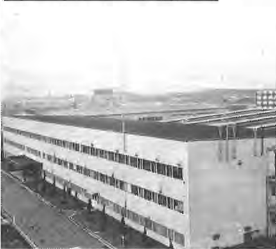
工場が建ち並ぶ十余二工業団地

昭和四十四年柏市工業調査の結果がこの程まとめられました。 この工業調査は、工業統計調査規則にもとづいて、毎年十二月三十一日現在で行なわれるもので、調査の結果では、事業所数は三百九、従業者数は一万九百八、年間の製造品出荷額は、七百七億七千九百二十六万円となっています。 この数字を、昭和四十年と比べてみると、事業所数で一・五倍、従業者数で二倍、製造品出荷額は、五・三倍近くになっています。