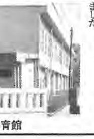
できあがった一小体育館