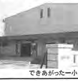
できあがった一小体育館