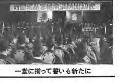
一堂に揃って誓いも新たに