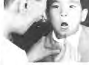
歯の検査を受ける子どもたち(三小で)

労働省では、総理府と協力して働く青少年のみなさんからの生活文と詩を募集しています。内容は、みなさん自身の働く生活の真情や、体験を通しての感想考え方など、題名は自由ですが、できる限り次のうちから選んでください。 (1)私の生きがい (2)私の余暇生活 (3)その他、就職後のあゆみ、離職の体験、ふるさとを離れて働く生活など。 応募資格者は、昭和二十六年四月一日以降に生まれた働く青少年の方となっています。 作品は、一人一篇、未発表の自