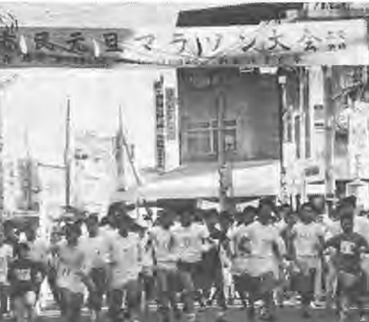
元旦の朝を元気にスタート

四十六年お正月恒例の、市民元旦マラソンは、午前十時天王操境内をスタート、初春の市内を一巡するコースで行なわれました。当日は、マラソンで今年一年を元気にスタートしようとする二百六十名が参加。一般の部や高校の部など五部に分かれて、それぞれ日頃鍛えた健脚を見せつけられました。