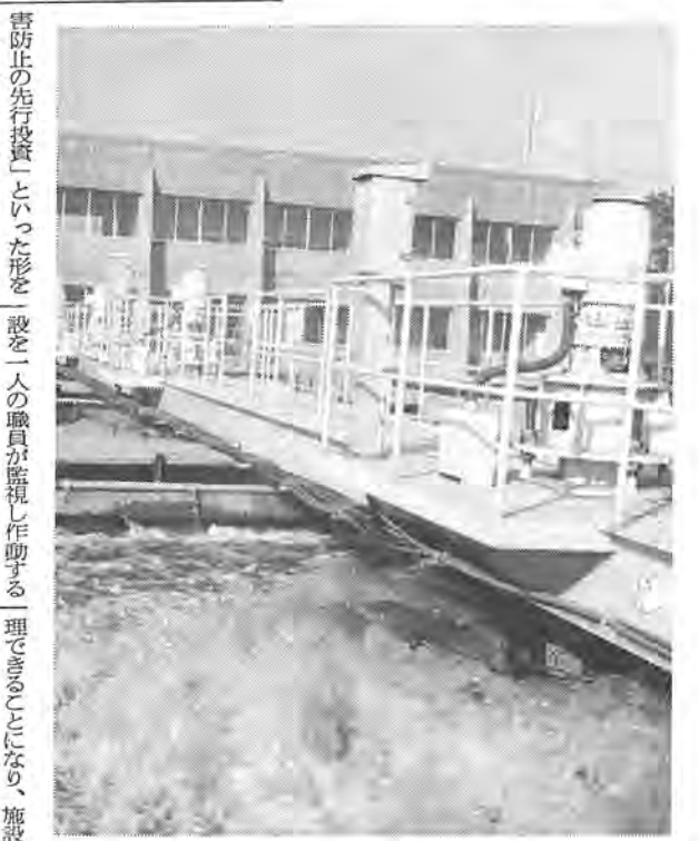
微生物の繁殖をたすけ、汚水の分解を促進するために活動するばっき槽

備えられ、本格的な運転を開始しました。十餘二工業団地の特別都市下水路は、団地内の工場汚水や雑排水などを一括処理する集中処理方式ですが、一般にこのような下水路が進出した企業から出る汚水で河川等の汚れに悩まされるため設置されるというケースが多いのにくらべ、ここでは団地造成時に公害を未然に防止するため、当初から施工されたもので、いわば「公害防止の先投資」といった形をとっており、しかも市が直接施工し運営、管理に当たるといふ、全国的にも例のないモデルケースとして大きな注目を集めています。