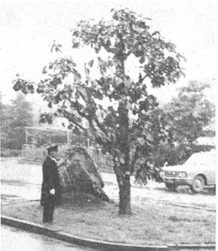
市庁舎前の「かしわ」の木

市制施行直後の調査からすると、十万人を越えていると、この発展のテンポに見合う、充実した市政こそ課題である。