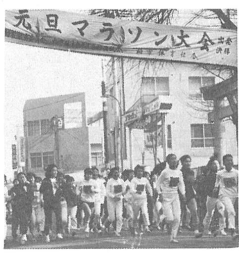
新春をスタート(今年の元旦マラソン)

新春を飾る第10回市民元旦マラソン大会が行なわれます。 大会は、一般・高校の部、中学の部(三十五歳以上)と女子の部、壮年の部、女子の部の四つに分かれ、午前九時に天王様境内(柏駅東口)をスタートします。 市内に住んでいる人や、通学通勤している人ならどなたでも参加できますので、ふるってご参加ください。 ○集合 午前九時半柏駅東口天王様境内(雨天決行) ○コース 市内を循環するコースで、距離は、一般・高校の部七千四百米、中学の部三千七百米、壮年の部(三十五歳以上)と女子の部二千四百米となります。 当日は、マラソンにふさわしい服装で参加し、お酒を飲んだら出場は認めませんのでご注意ください。 各学校ごとにまとめて申し込みください。