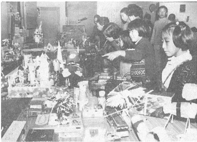
楽しい作品がたくさん並ぶ会場

果内でも珍らしい小中学校工芸工作、彫製展が、去る十一月二十日から三日間中央公民館で開催されました。 この催しは、日頃図工科で学んでいることを生かし、身近にある材料の特徴を生かして自分の考えで利用し、構造や形の美しさを表現して創意、創造性を伸ばすという、教科指導の成果を集めたもので、出品数は、市内全部の小中学校が一学級一クラスづつ参加し、四百七十点余のものがあつた。 作品は、すべて色紙や紙糊、輪ゴム、竹などの特性を生かして生かしたものや、粘土、石膏などの材料を使って心においたことや感じたことを具体的に表現した傑作ばかり。 展示会の運営や指導にあつた先生方は「初めての試みとしては予想外の成果で、種類や形も豊富なものが集まり、今後の図工教育にもよいヒントを得ました」と語り、また、会場を訪れた父兄からは「あのうわでこんなおもしろい鳥ができるの」と子どもたちの創造性の豊かさを感じていました。