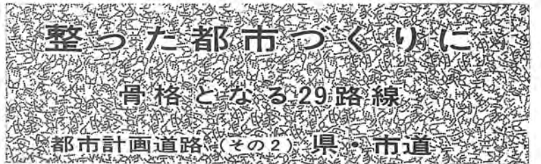
整った都市づくりに 骨格となる29路線

11月 国民健康保険税 第3期個人事業 税第2期の納期 です お忘れなく 納税を