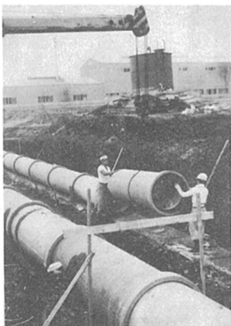
明日の都市づくりに伸びる下水道

柏市でも、新しい都市環境整備のため、市街地を中心に四百五十ヘクタールの排水面積をもつ公共下水道整備計画をたて、そのうち第一期計画として、昭和三十五年度から四十八年度まで、二百三十三ヘクタールの排水区に、幹線下水道工事を進めています。