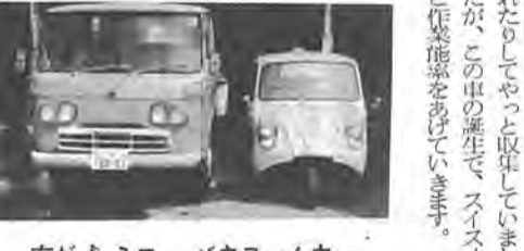
右がミニバキュームカー

センター、長さが三米三九センチとなり、今までの車と比べて、車幅で四センチ、長さで二米二センチも小さく、三・五米あればクルッと回れます。今までの車は、狭い所や坂の下などくみづらいた方が、バック