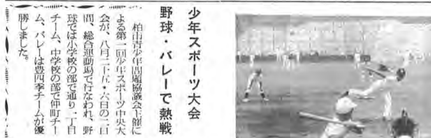
熱戦をくりひろげる少年野球