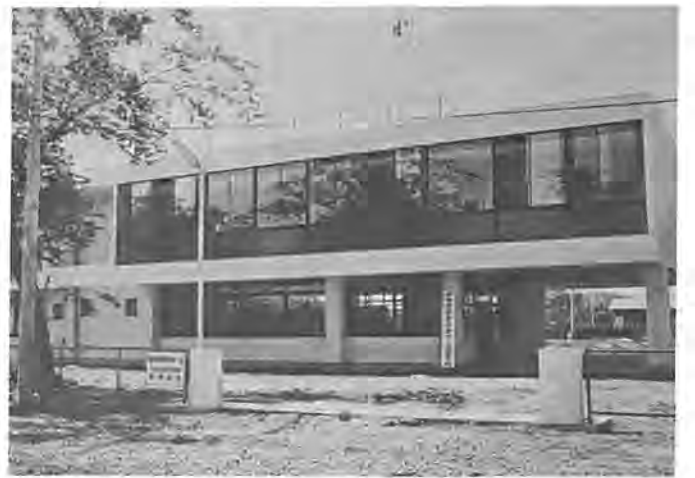
整備された施設で利用を待つ勤労青少年ホーム

から、野田と布旗方面へ向うバスで、布旗入口で下車、徒歩五分、富勢中学校のすぐ隣です。利用申し込みは、事業所単位でも、個人やグループでもできます。利用当日直接ホームへ申し込んでください。 多数の方が一度に利用したい場合は、事前にホーム(67-660九八)へ連絡しておくと便利です。また、六月からは、料理、お茶、お花など七講座が開かれ、各講座とも月一回、年間四十時間程度の規模で行われます。 利用時間は、平日午後一時から九時(毎週木曜と祭日は休館)、日曜日は午前九時から開館します。利用は無料、講習の際教材費だけ自己負担となります。 ホームでは、このほか映画の鑑賞会やキャンプ、バス旅行などの催しのほか、結婚相談もお受けします。 仕事の終わった後や休日、事業所や親しい仲間と一緒にぜひご利用ください。