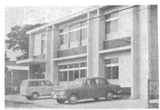
白亜の線が美しい婦人児童センター

市内酒井根三七番地に、婦人児童センター「光ヶ丘集会所」が誕生しました。この施設は、母子のしあわせを願う山澤市政のひととして建設されたもので、コンクリート