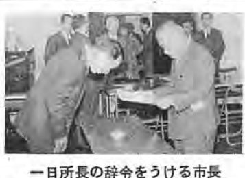
一日所長の辞令をうける市長

この日の相談件数は三十二件で、道路問題が一番多く次いで、ごみ処理、税金、遊園地などで、特に最問題になっているのは、雑草の処理についてもありました。市では、これらの皆様の貴重なご意見を生かしてこれからの都市づくりにつとめたいと考えております。