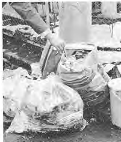
袋のまま置かずバケツの中へ

また、共稼ぎの方やゴミ収集の際に留守にしがちな方は近所の方にお願いするようご協力ください。