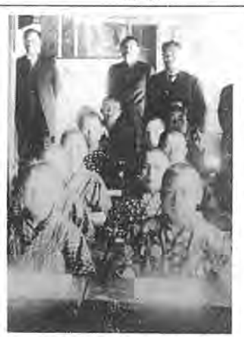
開校当時の東葛中学飯校舎、長全寺での授業

金融恐慌制により、小見川農商銀行、千葉合同銀行、野田商銀行等を吸収千葉銀行創設される