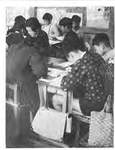
机も椅子もせまくなった

肥満児になるまえに、家庭内でのしつけによっていくらかでも防げるということを忘れてはいけません。この二つの調査の結果を基に、肥満児対策委員会を中心に、細かに分析、研究して基本的な対策の樹立を急ぐ方針を進めています。また、すぐできることとして、各学校の体育活動を強化し、この面でまず効果をあげられることを考えています。