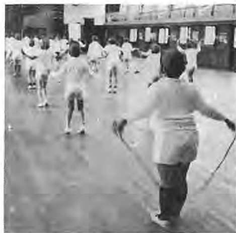
息とひともうればがんばる

食生活が豊かになり、子供が肥満になるかどうかが、どんな影響があるかを調べた研究があり、それがそれによると、普通の両親の場合四〇％、片親が肥満の場合六〇％、両親とも肥満の場合七二