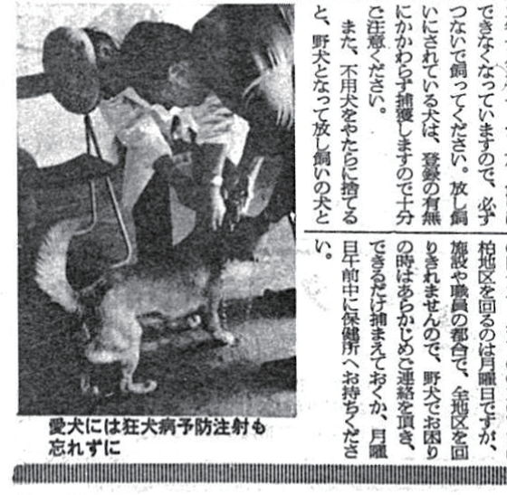
愛犬は狂犬病予防注射も忘れずに

犬の放し飼いはヤメテ 不用な犬は保健所へ 放し飼いなっている犬が、山みづけ、放し飼いの犬は、人に噛みつけたり、噛みつき、吠えたり、騒ぎまわったり、近所に迷惑を及ぼすおそれがあります。放し飼いの犬は、必ず保健所までお持ちください。なお、犬の登録や狂犬病予防注射は、飼い主の責任で受け取ってください。 同様に非常な迷惑を及ぼします。不用な犬は、毎月五日午前中に、必ず保健所までお持ちください。なお、犬の登録や狂犬病予防注射は、飼い主の責任で受け取ってください。 ドックセンター(沼津町高棟) 〇四七三二八(一〇五)〇五〇 柏地区を回るのは月曜日ですが、施設や職員都合で、全地区を回りきれませんので、野犬をお困りの時はあらかじめご連絡を頂き、できるだけお持ち帰りください。月曜日に保健所へお持ちください。