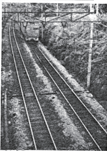
46年3月には、この線路が複々線化に

立ち入り調査の区域 ①南柏三丁目 ②豊四季字新木戸、中原、飛馬ヶ谷、上西側、上西山、中西山及び中ノ峠 ③篠田字入谷 ④相字竹藪、駒込、海道側、中割及び下西側 ⑤根字字田、中馬場、荒瀬、法花坊、上原敷 ⑥松ヶ崎新田字志落側