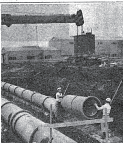
工場汚水を一括処理する下水道の布設工事、これが終末処理場へ

この議案に提案された議案は、十倉工業団地特別都市下水道建設に関するもの四件が提案されましたが、議案の内容は次の通りです。