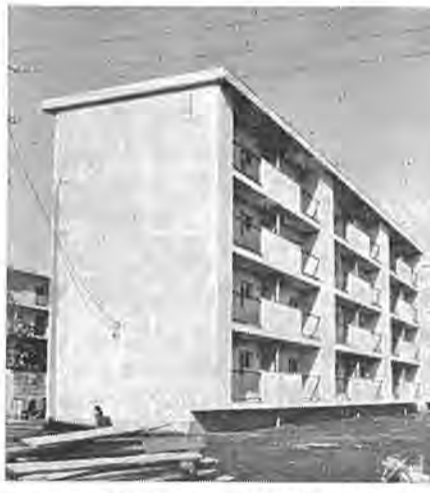
できあがった4棟目の改良住宅

昨年七月から根戸高野台に建築中の鉄筋四階建改良住宅が二月十四日に完成しました。 この住宅は、住宅改良法にもとづいて、同所にあった旧軍隊の老朽化した兵舎に在る人を主に収容するために建てられたもので、すでに三棟完成しており、七十二世帯が同居しています。 この完成で、さらに二十四戸入居することになりますが、一戸当りの面積は三十五平方メートル、六畳