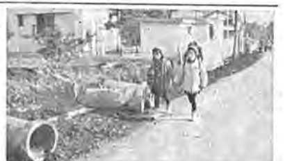
側溝のかさあげ工事が進む田中線

田中線(四小通り)は、従来設置されているガードレールの内側に側溝をかきあげ、これにふたをして歩道巾を拓ける工事と、酒井根線と同様な歩道新たに設置する工事、延長八百九十二米