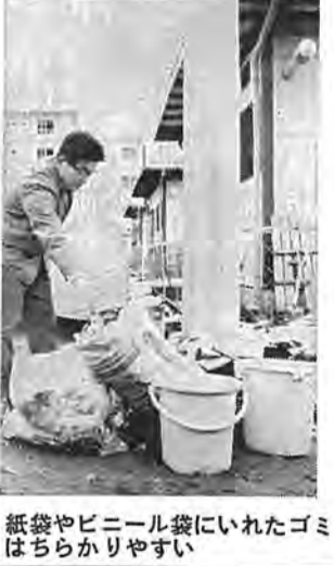
紙袋やビニール袋にいれたゴミはちらかりやすい

ゴミは ふたつきの容器で すでに、各地区を担当する清掃作業員からお知らせしてあります。が、三月一日から一部地域でゴミの収集日、時間が変更になっていきますのでご注意ください。 また、最近ビニール袋や紙袋にゴミをつめたまま置いてある例が非常に多くなっていますが、このような状態では、ゴミの分別ができません。買わないよう十分ご注意ください。