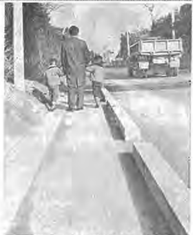
工事が完成すると写真のような歩道ができあがる

四月になると、全市で二千三百名に及ぶ新しい小学校一年生が誕生しますが、市では、この入学期を前に子どもたちを交通事故から守るため、光ヶ丘小学校前の市道酒井根線及び四小小学校前の市道田中線で、歩道工事を行なっています。 この工事は、従来歩道の区別のない比較狭い道路で、歩行者の安全をはかるために行なわれるもので、国の交通安全施設整備事業緊急措置法と通学路にかかる交通安全施設整備事業にもとづいて行なわれているものです。この