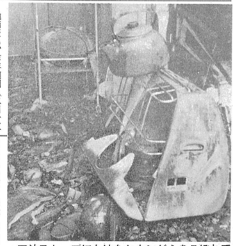
石油ストーブにかけたヤカンがふきこぼれて火災に火元を離れるときは必ず消してから、煙草を完全に消し、安全な場所に捨てておけば、この十一件の火災は、おこらずに済んだこととなります。

春の火災予防運動が、二月二十九日から三月十三日まで、全国一律に行なわれています。春さきは異常乾燥が続き、火災が発生しやすい、また大火になりやすい季節ですが、今年は特にひどく、県下でも火災が多く発生しています。 柏市でも、昨年同様(二月十五日現在十七件)に比べ、すでに三十三件発生し、ほぼ倍近く、特にそのうちの三分の一の十一件は、煙草の投げ捨てによって発生したものであると思われ。 火災は瞬時に、貴重な財産を灰にし、人命まで奪いますが、その原因は、ちょっとした不注意の、と思ひ込んでいる人が多いのですが、それは大きな誤りです。この制度は、若く働けるうちに、前もってかけ金を積立てておき、それに用いた方がより豊かな生活を送るためのものなのです。 加入届けをしないで、そのままにしておくと、せっかくつくれた年金制度のワケの外におかれてしまい、将来、当然つけられるはずの年金がつけられなくなります。このように出ないよう、必ず市役所窓口、または市役所出張所で加入手続きをすませてください。