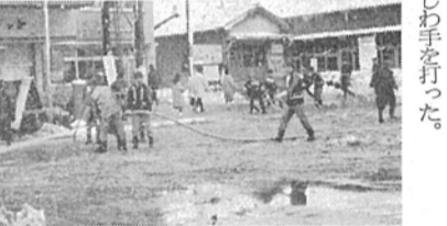
駅前広場で除雪作業をする消防団員

二面ホームの実現を懇請した。二月二十七日 第二処理場起工式に出席、この上は在野の全機能を投入しての完工を期待し、諸工事が無事にゆくよう願って神前かしわ手を打った。