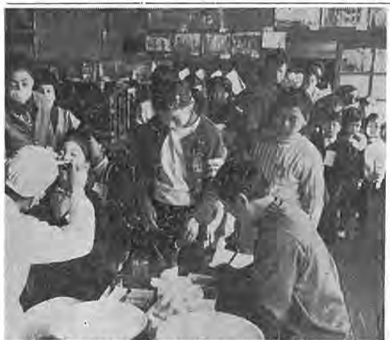
「今何をしているのかな」のそきこむ どの子もみんな元気だ(一小にて)

今年新しく入学する児童の健康診断が、一月十一日から市内の各小学校で行なわれました。一、四十七名