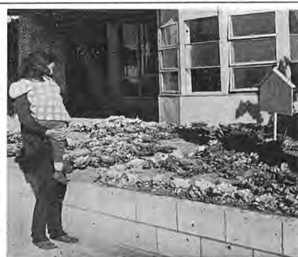
中央公民館前のモデル花壇

このほか、町会で花壇を造成したいという申し出があれば、若干の補助金も出しており、排気ガスで汚れやすい所は草花の植栽を考慮する、街中を花いっぱいにするため、今までの経験を生かした