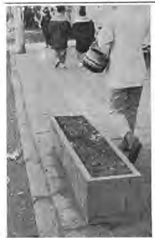
植えたはずの葉ボタンは一本もなくなくなつて……(駅前通りで)

今までは、市内六十力所にフラワーボックスを設置し、季節に合わせて、葉ボタン、デージー、パンジー、ペコニアなどを植え、また、