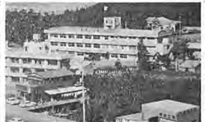
新庁舎、手前は十六号線

柏警察署新庁舎が竣工し、一月二十三日落成式が行なわれました。新しい庁舎は、柏市柏二六〇番地、鉄筋三階建、建築面積千七百二十平方メートルで、市役所北